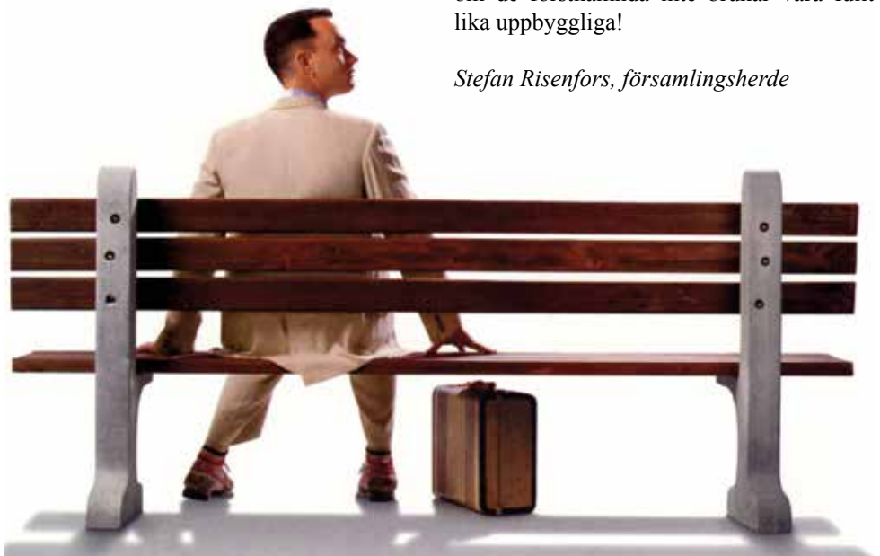
Bild nedan från den mycket sevärda filmen Forrest Gump med Tom Hanks – rättelsen är att Forrest sitter på en bänk och talar med främlingar.