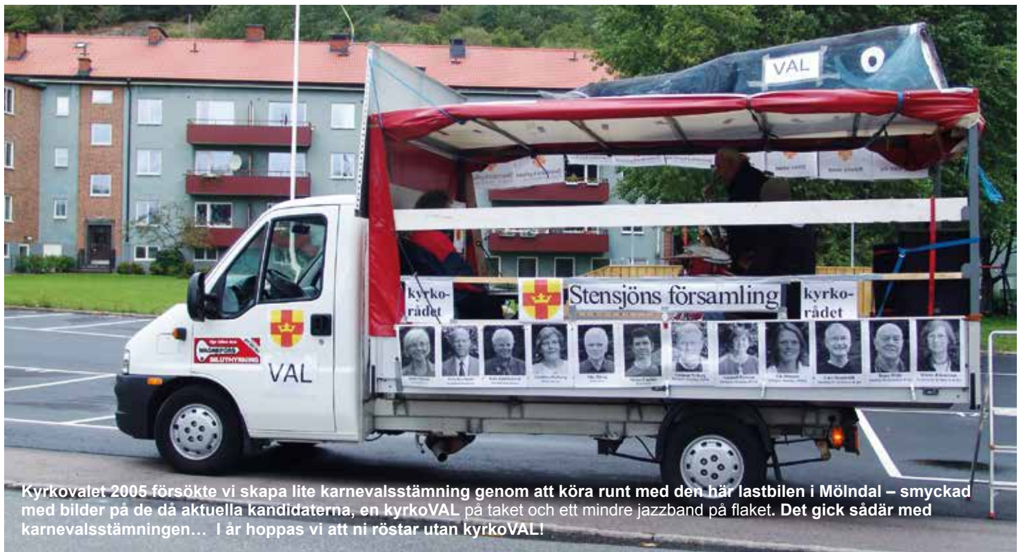
Kyrkovalet 2005 försökte vi skapa lite karnevalsstämning genom att köra runt med den här lastbilen i Mölndal – smyckad med bilder på de då aktuella kandidaterna, en kyrkoVAL på taket och ett mindre jazzband på flaket. Det gick sådär med karnevalsstämningen... I år hoppas vi att ni röstar utan kyrkoVAL!