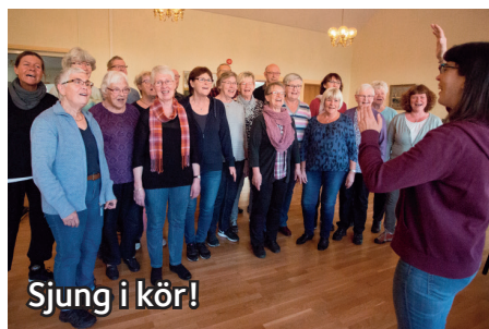
Sjung i kör!