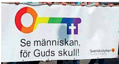
Alvesta församling, Växjö Pride 2017