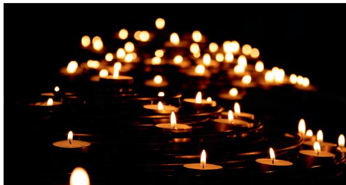
I Allhelgona besöker många kyrkogården för att hedra någon de förlorat.