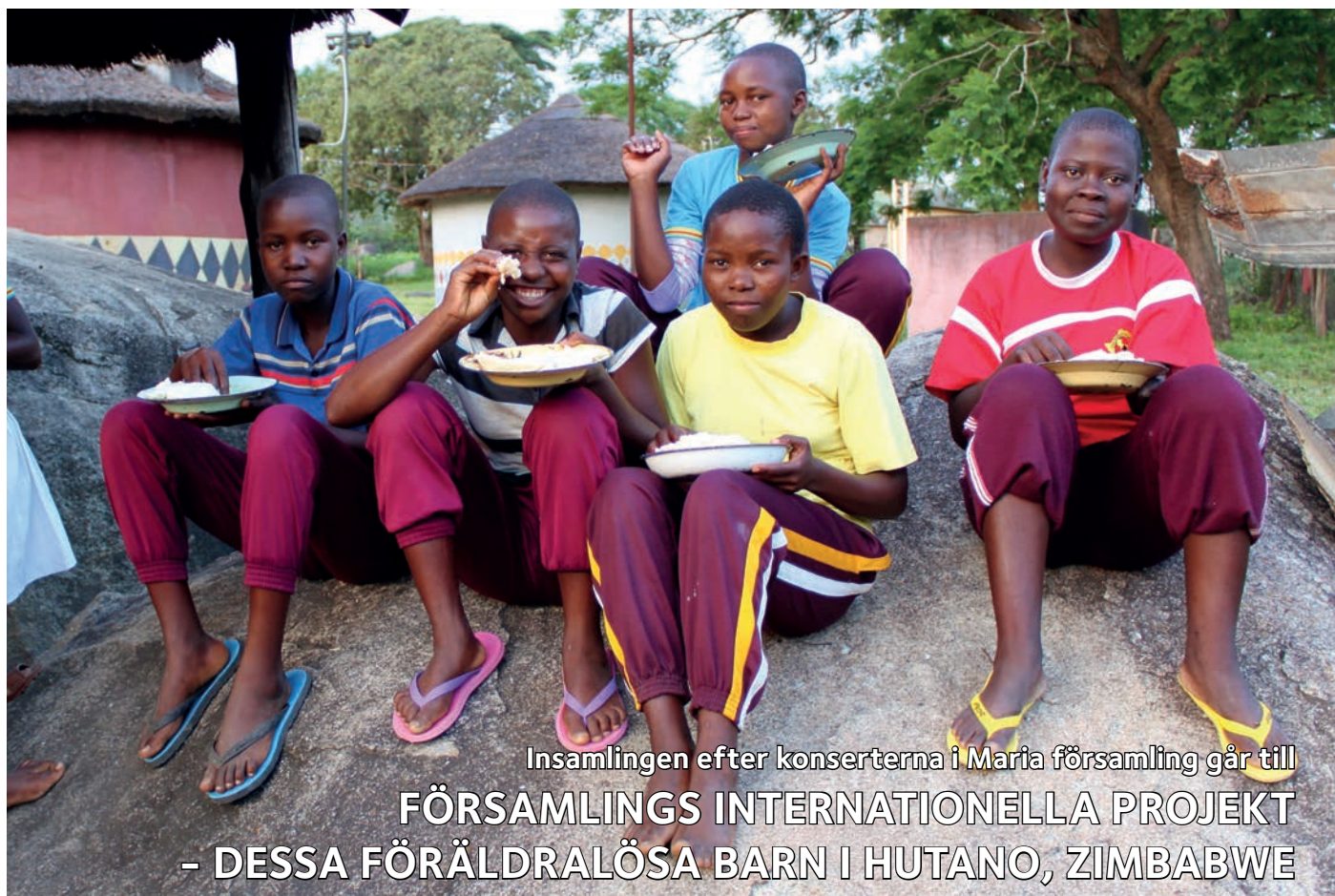
Insamlingen efter konserterna i Maria församling går till FÖRSAMLINGS INTERNATIONELLA PROJEKT - DESSA FÖRÄLDRALÖSA BARN I HUTANO, ZIMBABWE

Drygt 14 % av den vuxna befolkningen i Zimbabwe lever med HIV. Förväntad levnadsålder är 45 år. Antalet föräldralösa barn är nu mycket högt.