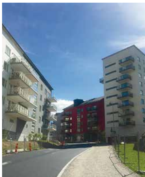
I det nya bostadsområdet i Tollare kommer Boo församling att ha verksamhet. Invigning 29 augusti! Lokalerna ser vi utifrån här till höger.