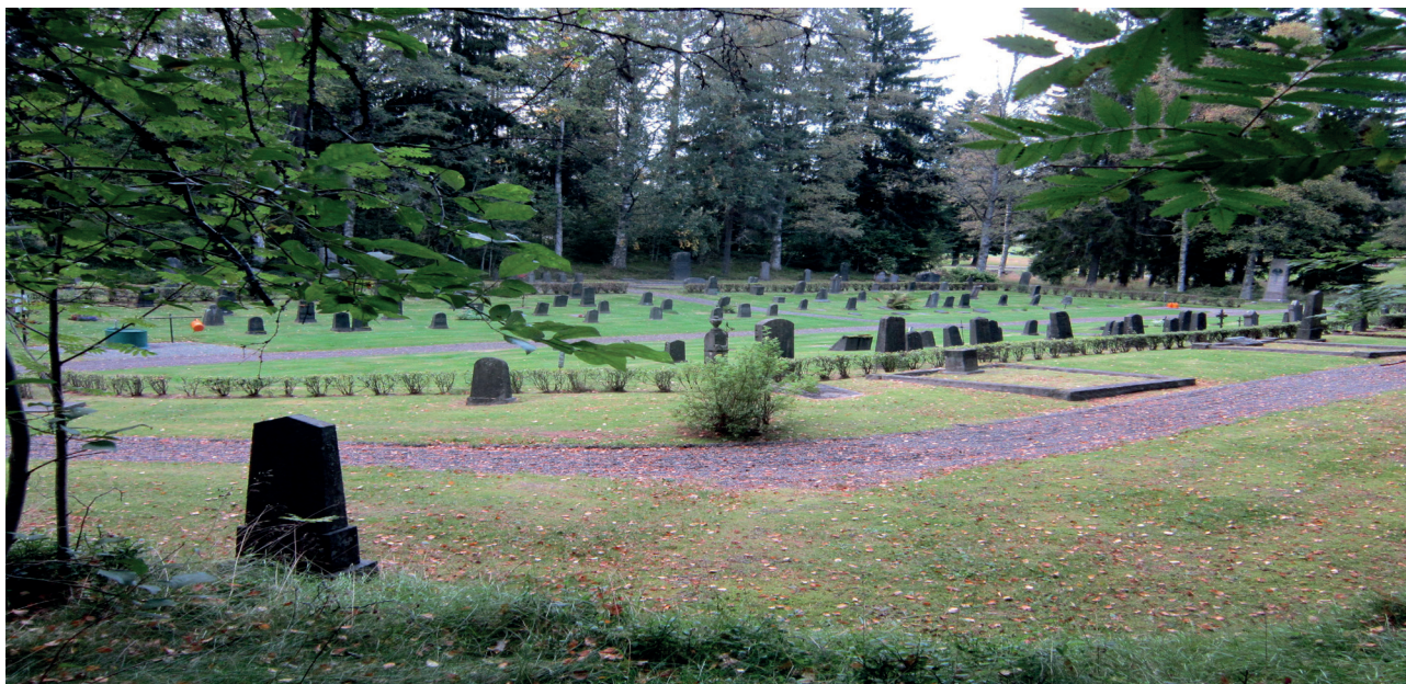
Den gamla kyrkogården finns i dag vid sidan om den nya.