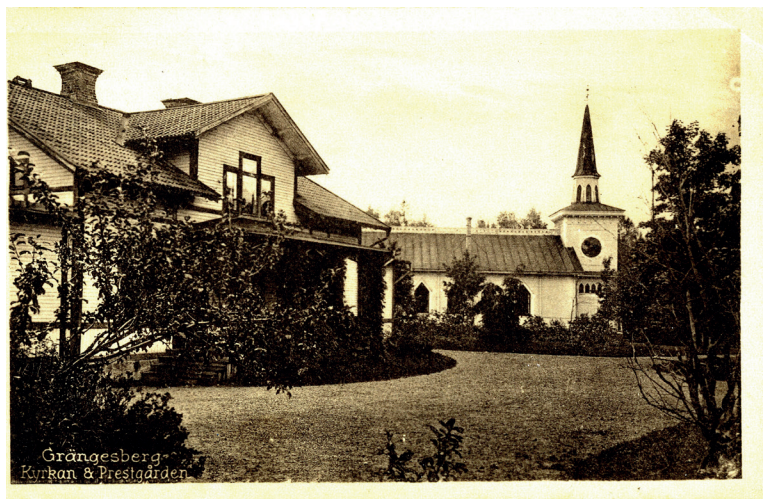
Vykort från 1915, Grängesbergs prästgård och kyrka.