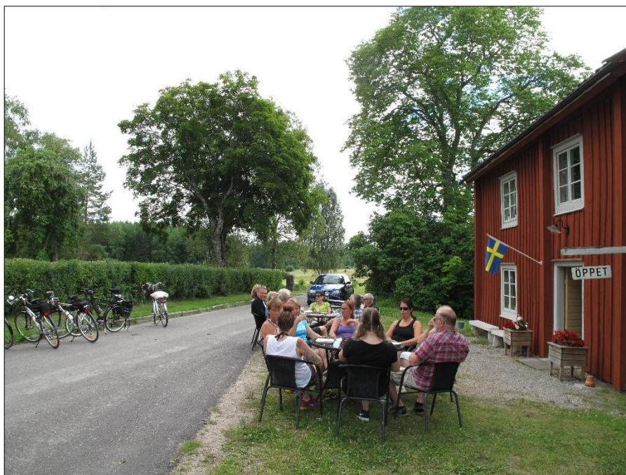
Café Amanda i Klockargården intill Karbennings kyrka.

Utställningen finns att se när Café Amanda är öppet 26 juni-6 augusti, lördagar kl 12-18 och söndag-fredag kl 12-17.