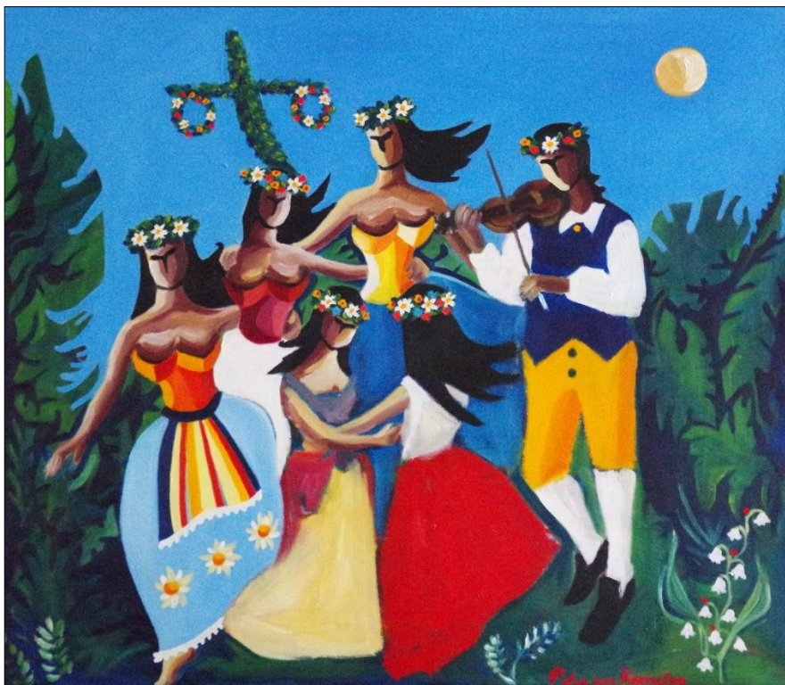
Konstverk av Petra von Knorring.