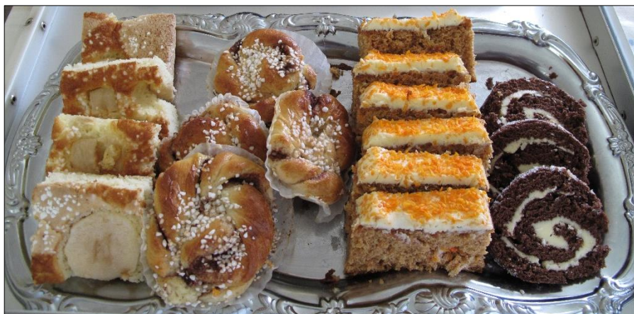
Café Amanda erbjuder gott kaffebröd i det gröna.

Kontakt: Församlingsexpeditionen, tel 0223-298 00.