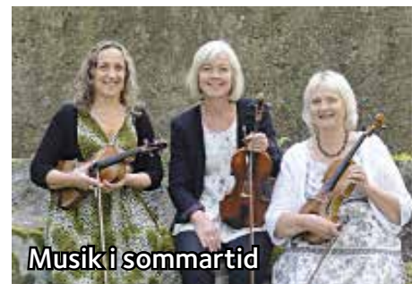
Musik i sommartid