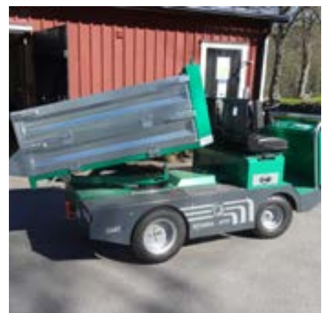
Inköpta miljövänliga eltruckar till Gärdhems och Västra Tunhems kyrkogårdar.