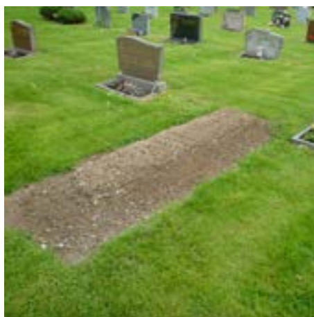
Under 2016 gravsatte kyrkogårdsförvaltningen 16 kistor och 122 urnor.