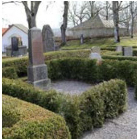
Nyplantering av häckar på Väne Åsaka kyrkogård.