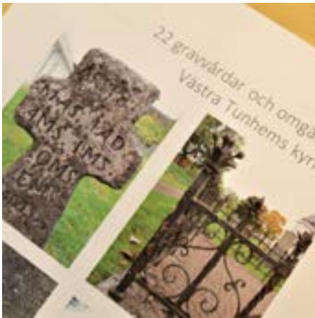
Åtgärdsprogram för 22 kulturhistoriska gravvårdar på Västra Tunhems kyrkogård.

Begravningsavgiften finansierar bland annat skötsel av våra kyrkogårdar, kremationer, gravsättningar och löner till kyrkogårdsvaktmästarna. Vi tar en liten närmare titt på vad som har gjorts på våra kyrkogårdar den senaste tiden.