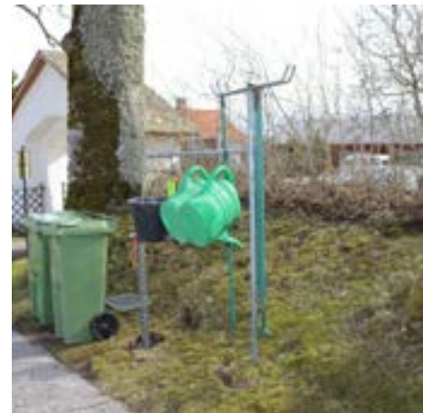
Ny servicestation iordningsställd på Väne Åsaka kyrkogård.