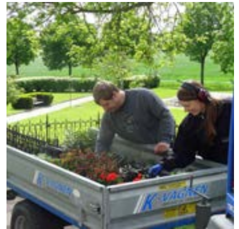
Begravningsavgiften finansierar lönen till 10 kyrkogårdsvaktmästare.