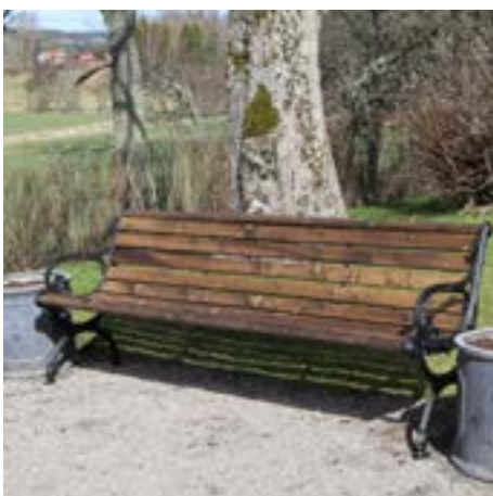
Inköp av ny soffa vid minneslundan på Norra Björke kyrkogård.