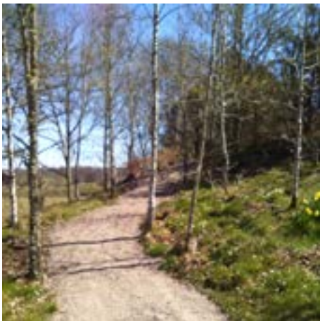
Vaktmästarna har anlagt en ny promenadväg vid minneslundan i Gärdhem.