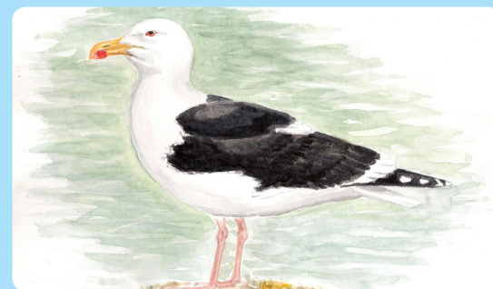
Här finns havstrut. Den förekommer längs våra kuster men är ovanlig i ett fåtal större insjöar.

Till er som utnyttjar denna möjlighet för en stunds skön avkoppling önskar Uppsala stift att ni tar största möjliga hänsyn till den flora och fauna som finns i området.