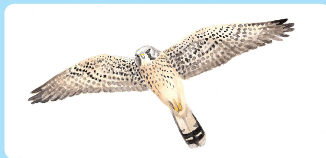
Tornfalken har setts häcka på Brusén.

Det råder stor brist på tallskog i åldrar över 150 år. Efter som skogsbranden påverkat skogens utveckling, kommer skogsförvaltningen att anlägga en så kallad naturvårdsbränning när omständigheterna tillåter. Därför tycker Uppsala stift att området ska få möjlighet att utvecklas utan påverkan av konventionellt skogsbruk. På detta sätt kan Uppsala stift värna om naturvärden och ge besökaren rika naturupplevelser.