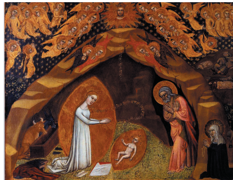
Jesu födelse enligt Birgittas uppenbarelse nr 21 i sjunde boken.

Efter diskussioner med Församlingsrådet och med Klosterkyrkans kaplan Christer Staaf kom vi överens om att placera bilden på körläktarens norra sida (baksida). Den valda placeringen har fördelen att erbjuda en lugn plats där besökaren kan läsa och begrunda bilden, den får en bra belysning genom ljuskronan som hänger precis ovanför och platsen erbjuder dessutom tillräckligt med utrymme för en guidad visning inför en grupp åhörare. Bilden sattes upp här under advent men kommer under våren att flyttas ner i Brödrakoret, då det är tänkt att en särskild ställning skall tillverkas till bilden och texten bredvid.