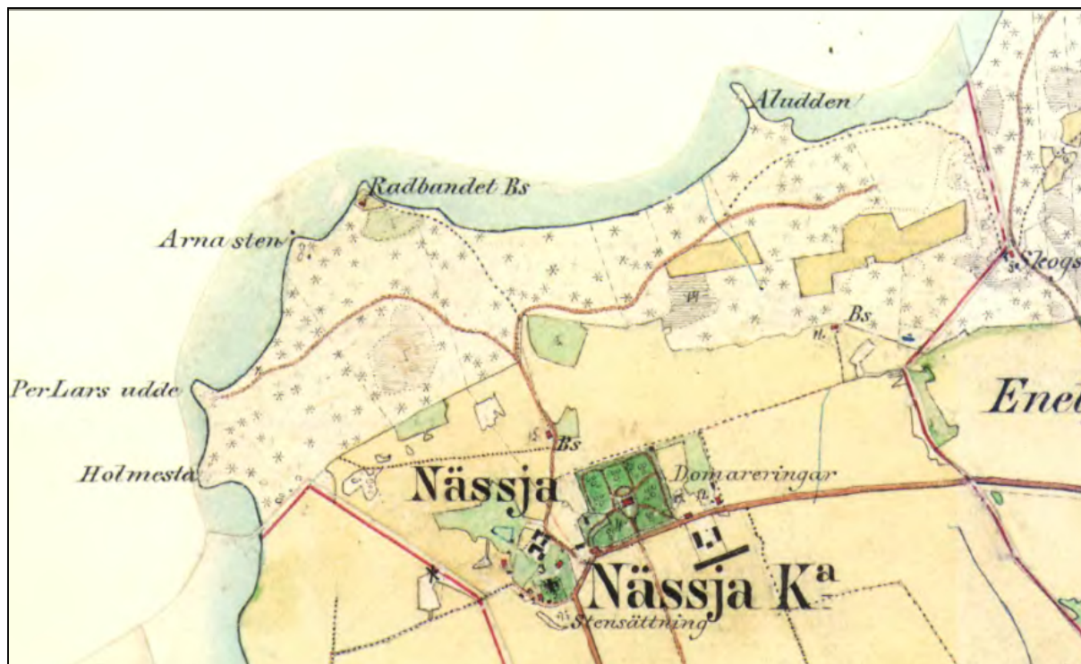
Utdrag ur Häradseconomisk karta 1868-1877, Nässja