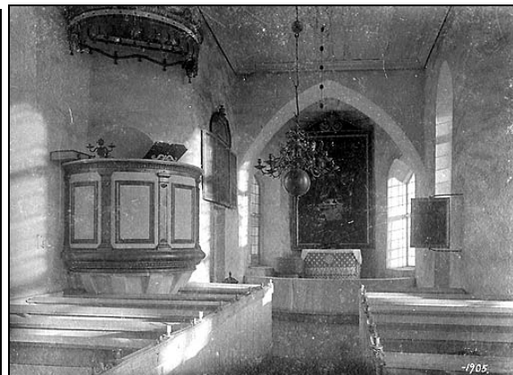
Nässja kyrka 1905.

Det finns väldigt knapphändiga uppgifter framtagna om Nässja kyrkas byggnadshistoria. Kyrkan är genom dendrokronologisk provtagning, d v s årsringsanalys, daterad till 1100-talets andra hälft. Kyrkans medeltida takstol är till stora delar bevarad och på Historiska museet i Stockholm finns sedan 1906 en ornerad bräda från den romanska takkonstruktionen. Kyrkan uppfördes av kalksten och gråsten med ett rektangulärt långhus och smalare absidkor. Senare under medeltiden valvslogs kyrkorummet och sakristian tillbyggdes vid korets nordvägg.