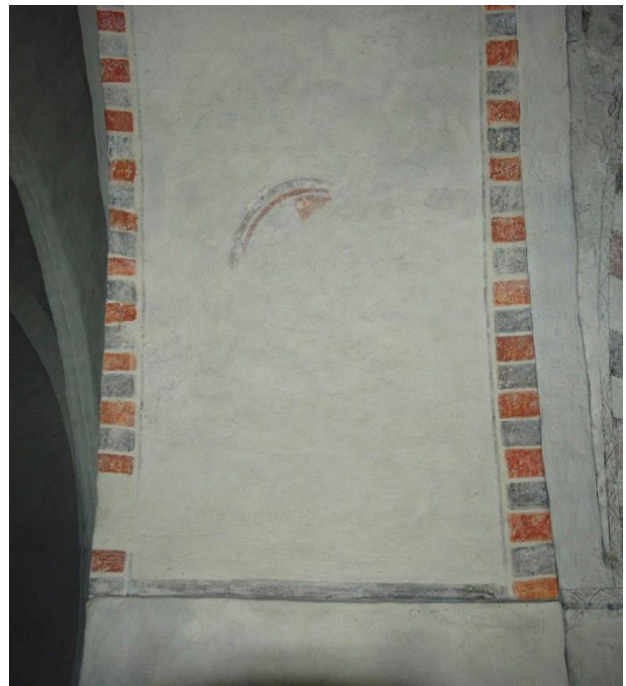
Triumfbågmuren. T.v. södra delen, t.h. norra delen.