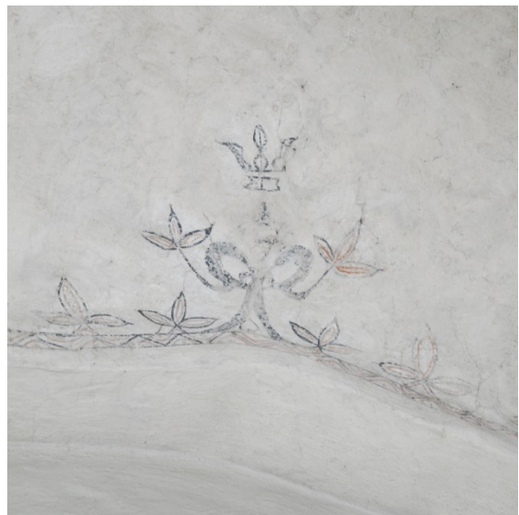
Korvalvets sköldbågar, måleri i öster, söder, väster och öster