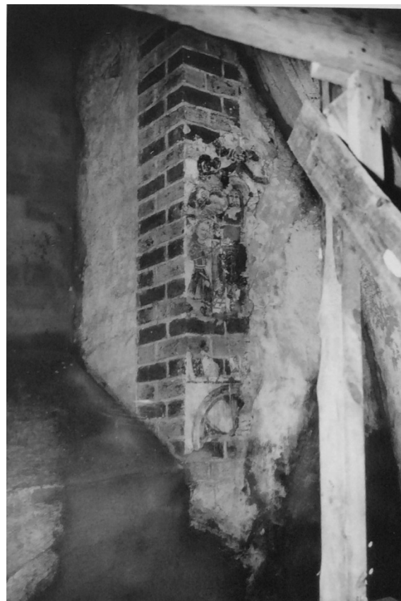
Strappotavlornas målningar i originalposition vid korfönstret. T.v. Jesu dop, t.h. Maria som förbedjerska..