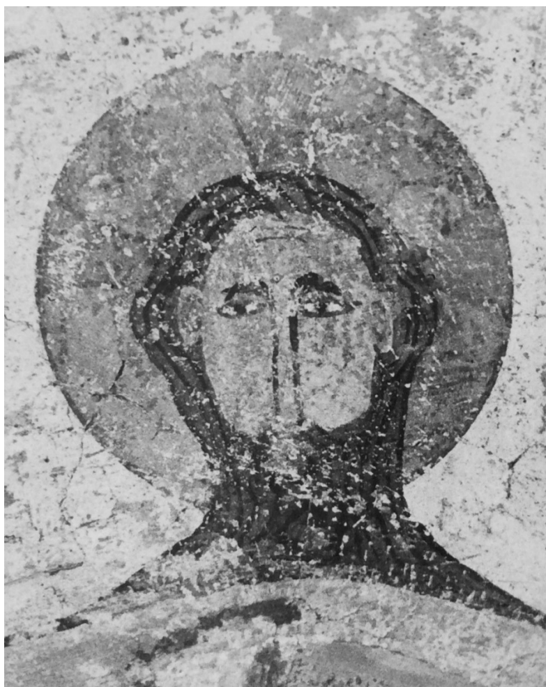
Samma bild som ovan, foto Niklasson 1957.