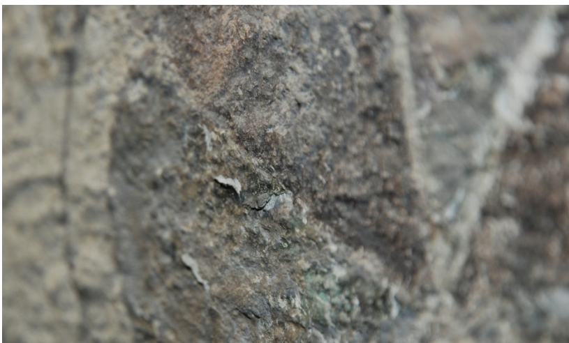
Detalj av den högra strappotavlan, exempel på flagningskada.