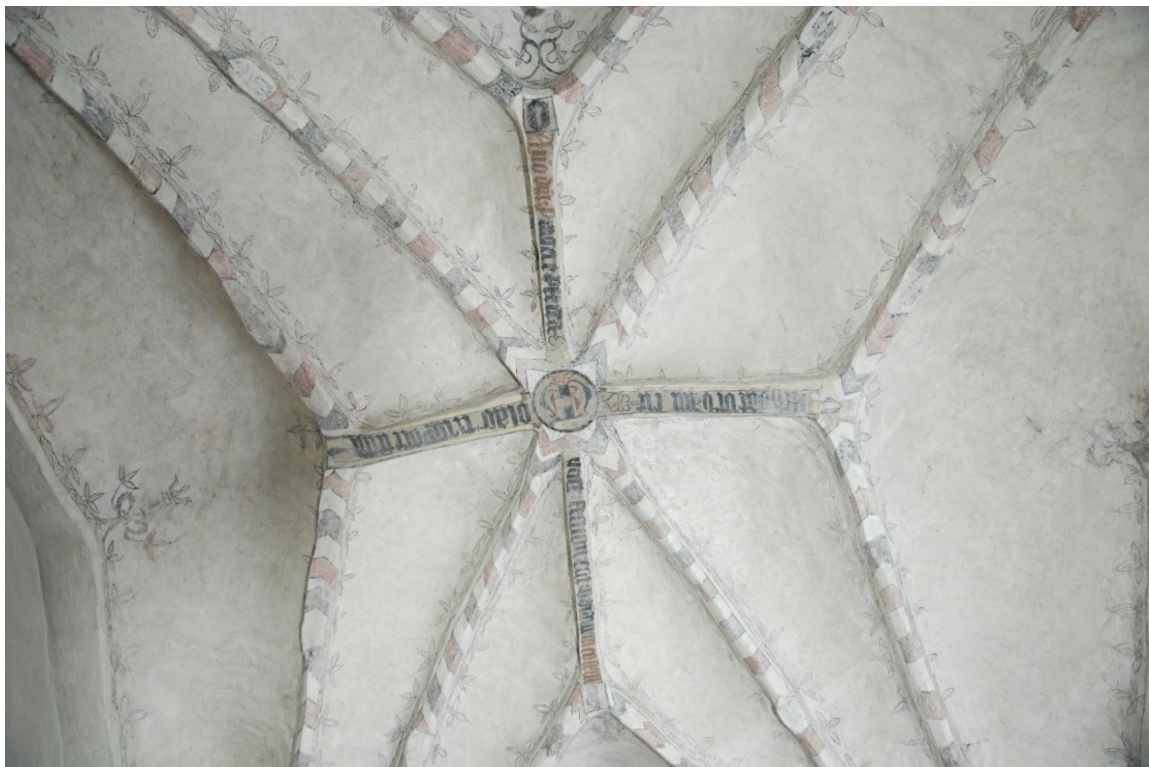
Stjärnvalvet i koret.