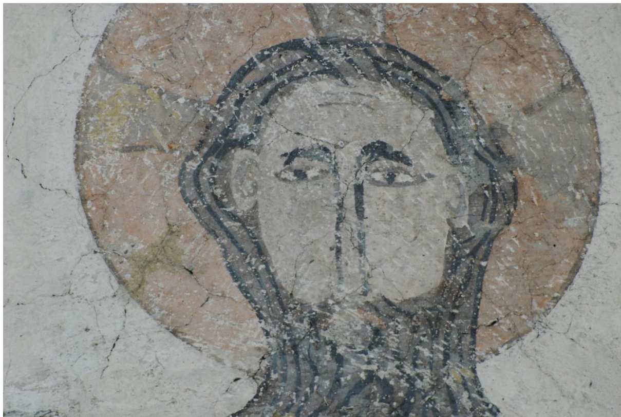
Närbild av Kristusbilden på östra sköldbågen. Man kunde befara att färgen skulle flaga efter behandlingen med kalkkasein 1991, men så är inte fallet.