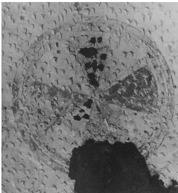
Triumfbågmuren, södra delen under framtagningen. Foto Niklasson ÖLM 1957.