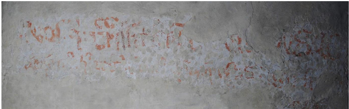
Texten på nedre delen av södra triumfbågmuren. Såvitt känt har inga försök gjorts att rekonstruera och tolka texten.

Nederst på den södra sidan av triumfbågen finns en mycket fragmentarisk text med okänd lydelse. Texten är målad med en ovanlig ljusorange färg, vilket inte kommenteras i konserveringsrapporten från 1991, men det förefaller vara originalfärgen.