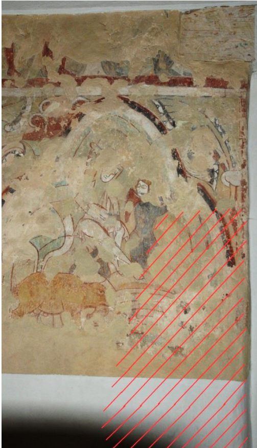
Bild 9: Fuktmätning i muren, den röda skrafferingen visar förhöjda fuktvärden (relativa tal 250-750, medan det är 140-150 på omgivande murverk). Utbredningen är ungefärlig, mätning gjordes inte direkt på måleriet utan endast på lagade putspartier.

Färgskikten bör noggrant dokumenteras i samband med konservering, och det bör utredas om något förebyggande kan göras för att undvika förnyade skador. En möjlig orsak till spjälkningarna är fukt i muren, men en översiktlig mätning (bild 9) antyder att skadorna inte är direkt korrelerade till förhöjda fukthalter.