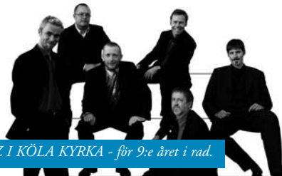
JAZZ I KÖLA KYRKA - för 9:e året i rad.

Second Line Jazz Band är nu inne på sitt femtonde levnadsår och är sedan länge etablerade som ett av Europas populäraste - och skickligaste - jazzband.