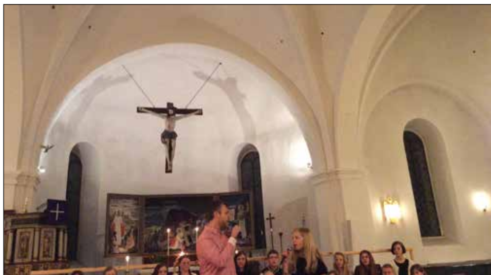
Konsert med föräldrar och körbarn 25 mars i Fränninge kyrka