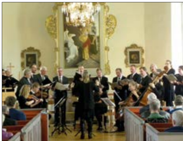
Långfredag i Långared