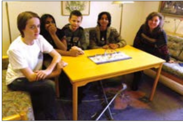
Konfirmander i Långared