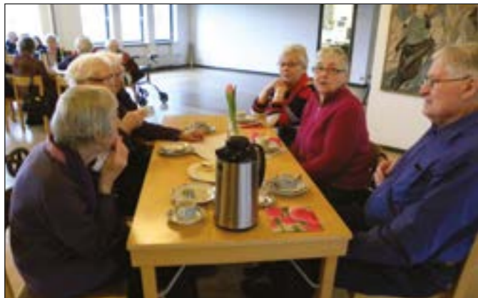
Dagledigträff i ett tomt församlingshem