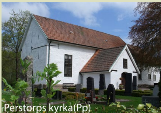
Perstorps kyrka (Pp)