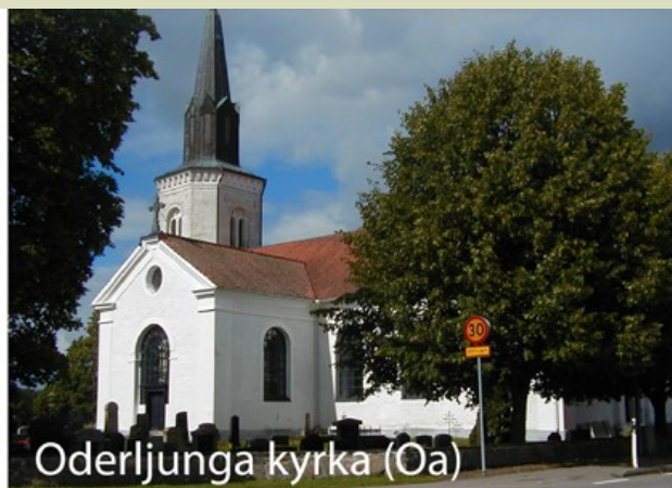
Oderljunga kyrka (Oa)