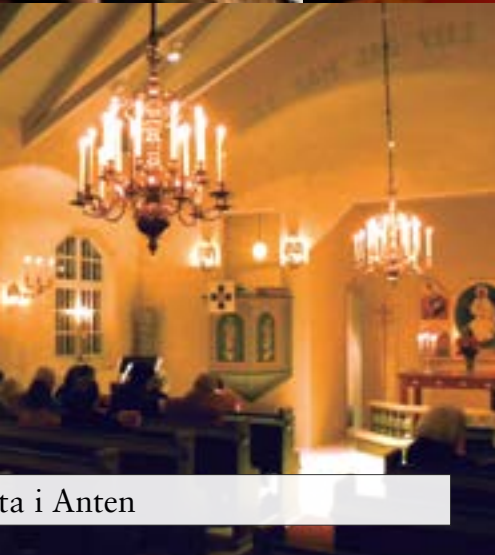
ta i Anten