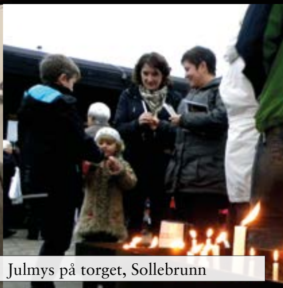
Julmys på torget, Sollebrunn