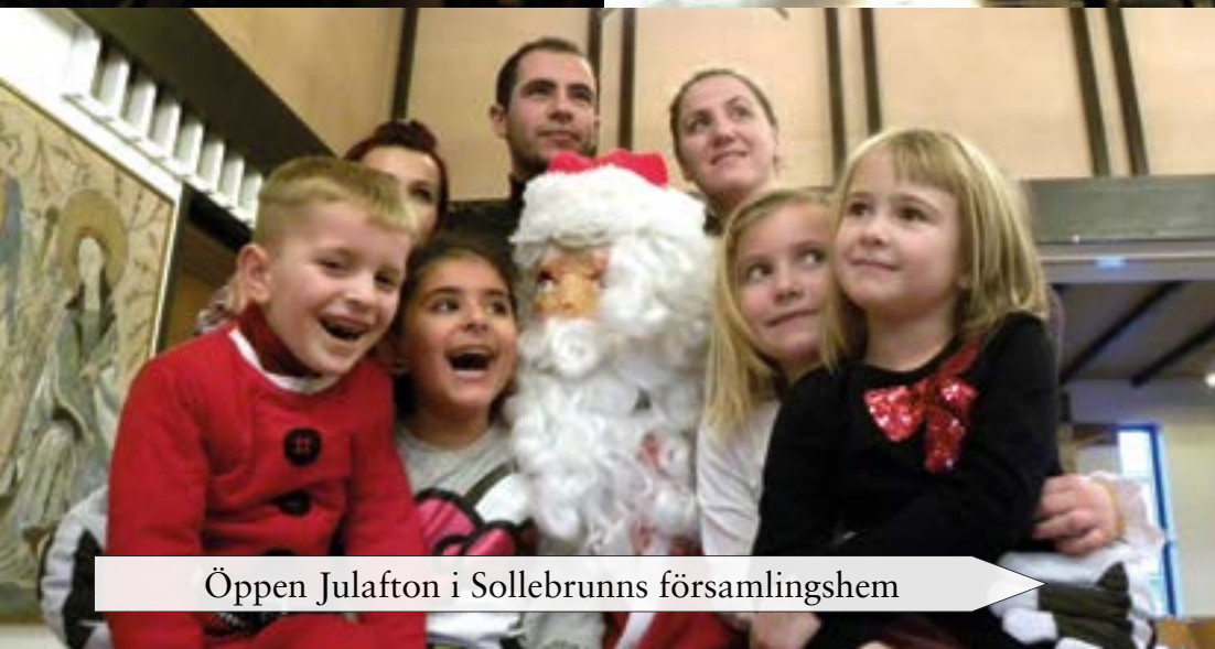
Öppen Julafton i Sollebrunns församlingshem