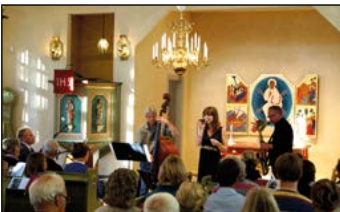
Nedan: Musik i Sommarkväll 2013