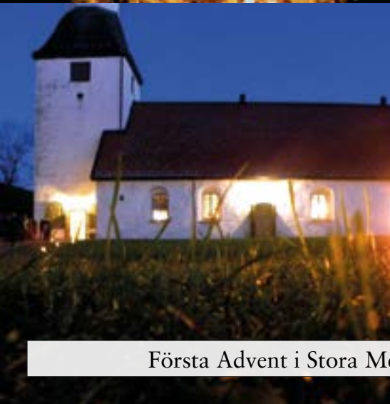
Första Advent i Stora Mellby kyrka