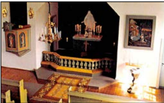
Ovan: tidigare altarty

Ovan bild från det färdiga kyrkobygget 1915. Nedan till höger den skrivna berättelsen med bland annat räkneskaper från januari 1916.