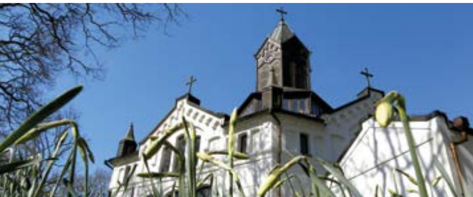
Vår vid Erska kyrka

Nästa nummer 21/5 2015 Manusstopp 16/4 2015