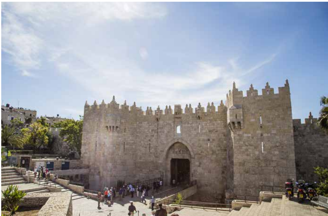
Damaskus porten i Jerusalem.