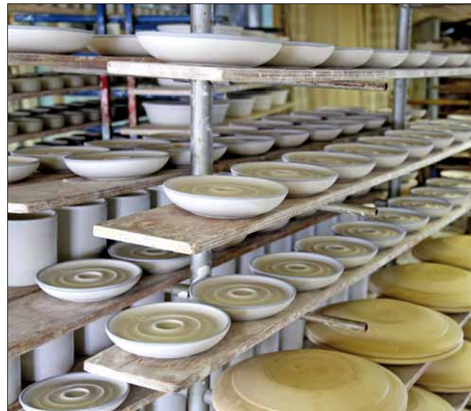
Doppljusstakar i väntan på att brännas