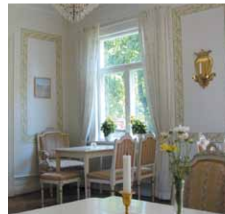
Möbler från Julita prästgård

Flygeln har blivit en lägenhet om tre rum och kök, där den gamla spismuren bevarats och upptar en stor plats. Här är lågt till tak och få räta vinklar.