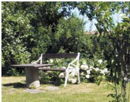
Soffa och bord framför pionerna