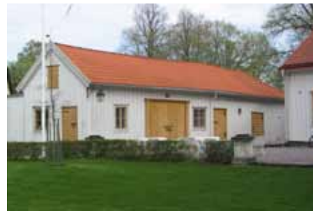
Huset med ekonomiutrymmen