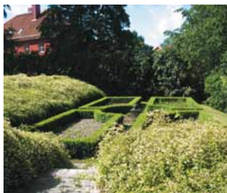
Vacker formklippt häck i rosenträdgården

Församlingen köpte fastigheten och gjorde nödvändigt underhåll av hus och trädgård. Först 1977, då fru Nilsson avled, kunde församlingen börja fundera över hur man ville använda gården och hur den skulle restaureras.