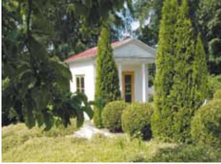
Lusthuset i lummig grönska

Trädgården, som fått förfalla, tas nu om hand av kyrkogårdsförvaltningen. Terasser och murar som rasat har reparerats. En plan för åtgärder har godkänts av riksantikvarieämbetet, eftersom även trädgården ingår i byggnadsminnesförklaringen.