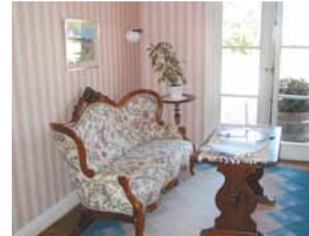
Soffan utanför arbetsrummet