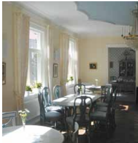
Kopior av 1700-talsmöbler i salen

Att i någon mån återge bottenvåningen karaktären av prästgård, var en av många tankar då arbetet med inredningen började. Det första som köptes var möblen i rummet mellan biblioteket och salen. Den har stått i Julita prästgård. I salen är den stora Karl-Johansoffan en gåva, som i någon mån fick styra den övriga möbleringen i rummet.