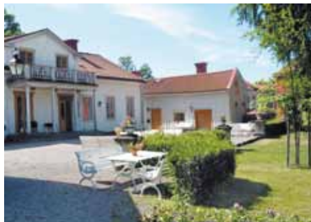
Huvudbyggnaden från trädgården

De tidigaste anteckningarna om fastigheten, som vi känner till, finns i Nyköpings stads "Tompte book" 1668 och "Geometrisk gäldebok" 1674. Där framgår att 2/3 av 7:e stocken, nuvarande kvarteret Åvallen, ägdes av kyrkoherden i Östra församlingen, Andreas Magni Julinus.