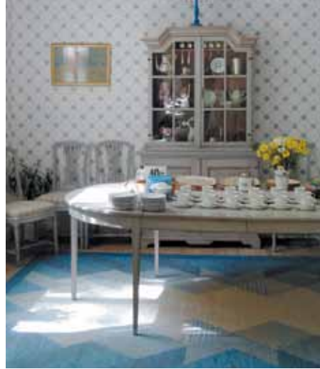
Barockmöblerna i rummet utanför köket