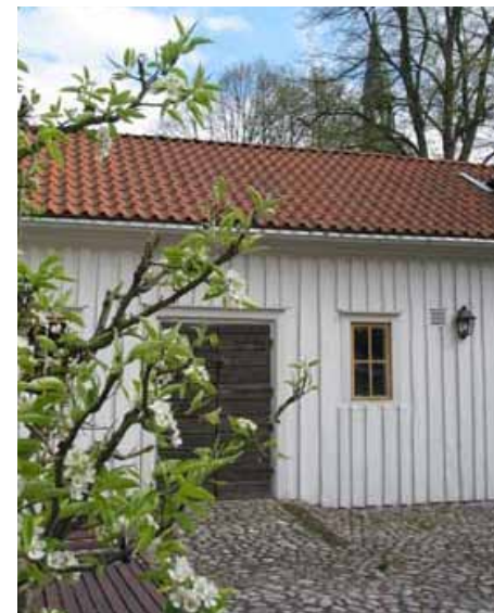
Porten till stallet på innergården

Under de närmaste hundra åren bytte gården ägare några gånger. På 1850-talet ägdes den av släkten Sparre, som lät bygga om stora huset som då fick sitt nuvarande utseende med frontespis mot Östra torget.