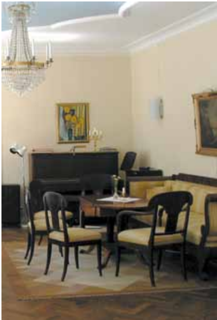
Karl-Johansoffan i salen