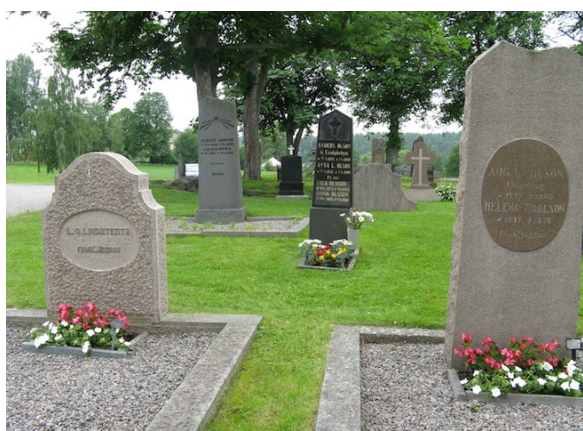
Gravvårdar i kvarter 3.