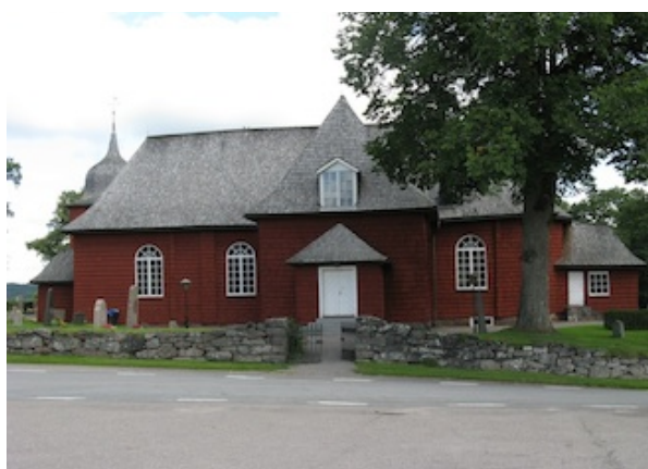
Kyrkan från söder.

Strax utanför kyrkogården i söder ligger församlingshemmet, uppfört under 1800-talets första hälft, samt en ekonomibygnad.