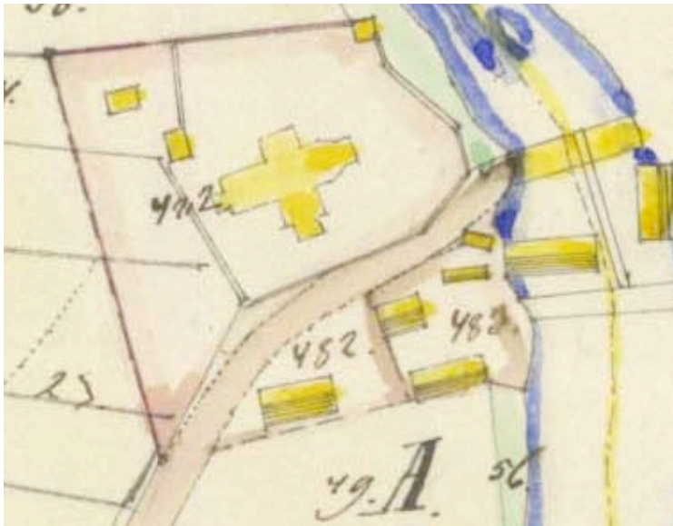
Karta från 1859, före utvidgningarna norrut på 1890- och 1950-talen. Karta från Lantmäteriet.