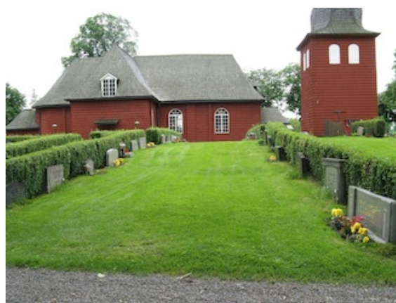
Kvarter 6 med rygghäckar och breda, låga gravstenar.