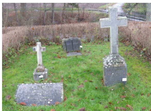
Gravstenar från sent 1800-tal och tidigt 1900-tal i kvarter 1.