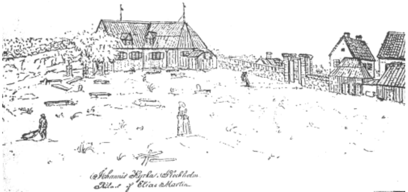
På denna teckning av Elias Martin ser vi Johannes gamla träkyrka, t.h. byggnader tillhörande drottninghuset och fattiginrättningen på Brunkeberg. (1700-tal)