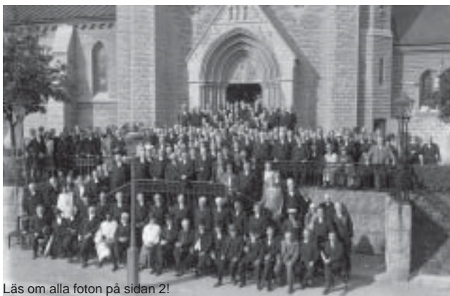
Läs om alla foton på sidan 2!