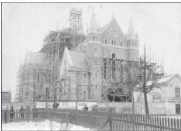
Från bygget av Olaus Petri kyrka. Lagg märke till "Velocipedverkstaden"!

Det kommer att märkas på olika sätt under året. Vi vill gärna ordna en utställning över souvenirer, vykort, konstverk och andra föremål som visar upp kyrkan. Det vore ett roligt sätt att framhålla betydelsen av just Olaus Petri kyrka. Några föremål har vi redan fått fatt i, men vi behöver mycket mer. Du som har sådana föremål och kan tänka dig att skänka, eller låna ut dem till församlingen - hör av Dig till oss. Per telefon: 019-15 46 61 eller per mail: olauspetri.pastorat@svenskakyrkan.se .