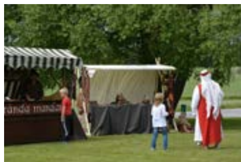
Medeltidsdagen drog många besökare, en del hitresta från en annan tid (?).

Medeltidsdagen avslutades med en medeltidskonsert , som varit kyrkokörens stora projekt under vårterminen. Den månghövdade publiken satt trolldunden