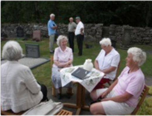
Mingel på kyrkbacken