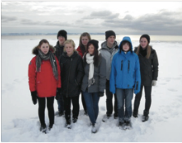
Våra konfirmander på läger i Gullbranna. Konfirmationen blir i Kungsäters kyrka den 8/5