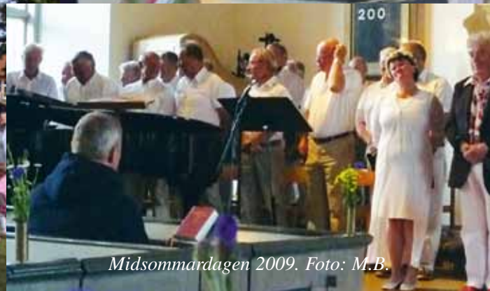
Midsommardagen 2009.