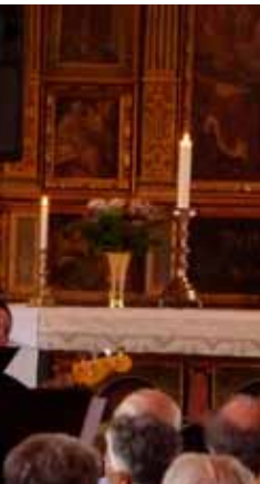
Helgmålsbön i minneslunden pingstafton.