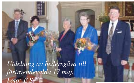
Utdelning av hedersgåva till förtroendevalda 17 maj.