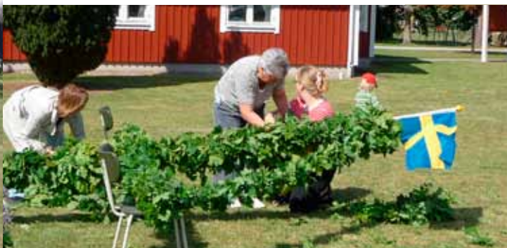
Majstången kläds 19 juni 2009. Dans kring majstången midsommarafton 2009.