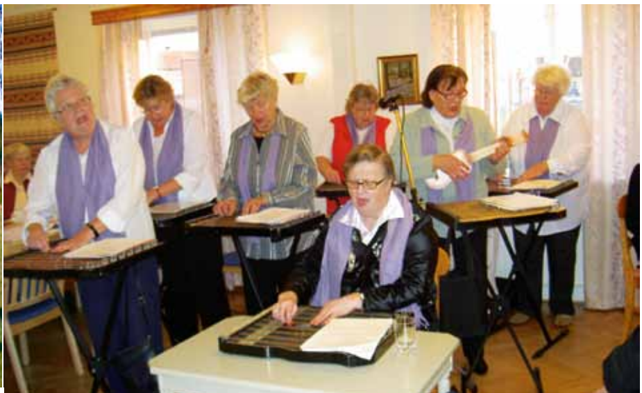
Torsdagsträffar: . Cittrornellorna gästar.