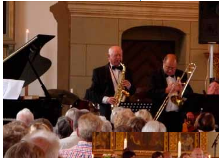
Konsert med Marinens musikkår 18 september.