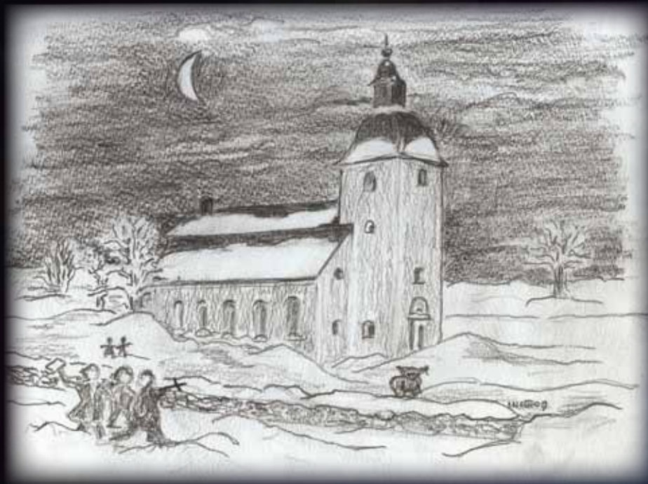
Årsgång av bildhuggare Inge Rolander, 2009.