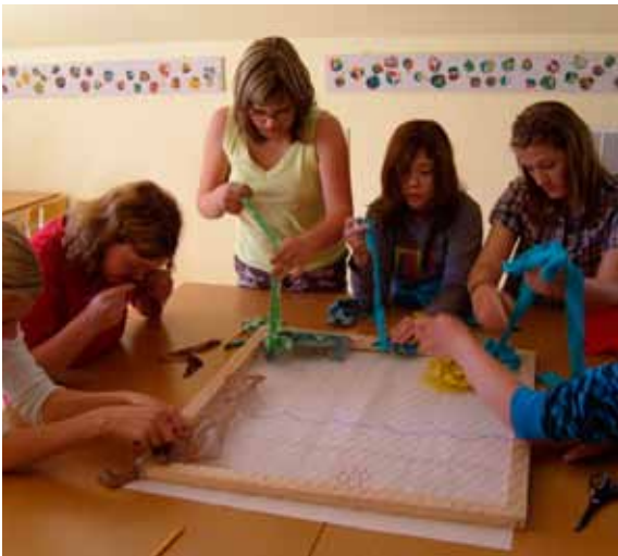
Diakoni och Lutherhjälsgrupps ut-färd till Breanäs vid Immeln.