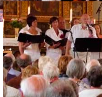
Musikgudstjänst den 2 august