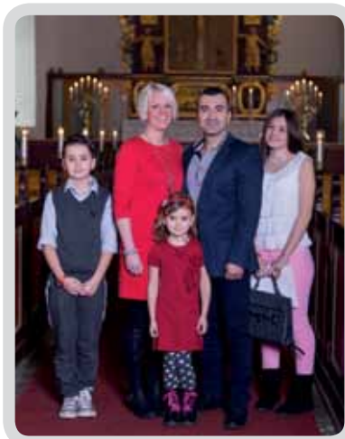
Ett av 10 par som gifte sig på Drop-in-vigsel Västra Tunhem