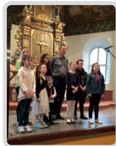
Familjekör Västra Tunhem