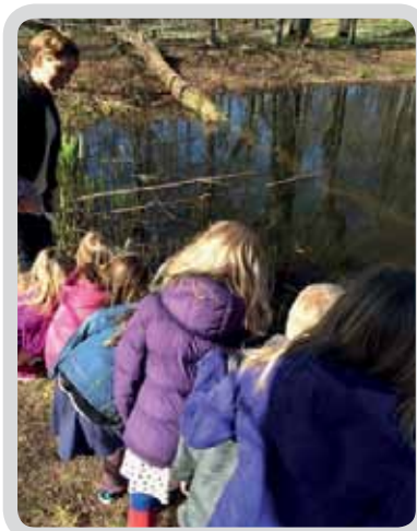
Kidz i Vargöns kyrka tittar på grodyngel