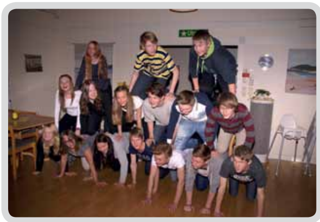
Konfirmander i Väne Åsaka