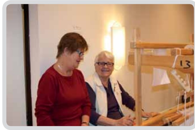
Glada damer i Vävgruppen i Vargöns kyrka