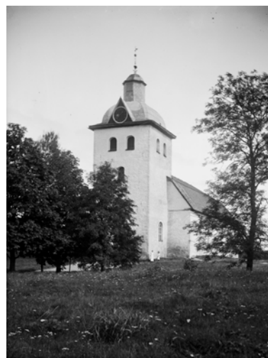
Kyrkan och kyrkogården från sydväst. Inga gravstenar syns.