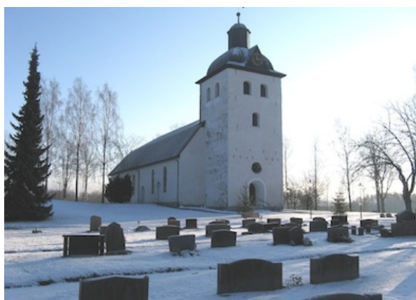
Del av kyrkogården. Foto taget från nordväst.

Kyrkogårdens grusgångar är raka och rätvinkliga. Några gångar tar slut mitt inne i kvarteren. Plattgångar finns inne i kvarteren och runt kyrkan. Gravhäckar, järnstaket och stenramar har tagits bort under åren, vilket ger kvarter med stora sammanhängande gräsytor. På kyrkogårdens äldre delar finns ett femtiotal grusgravar och några få gravvårdar med järnstaket.