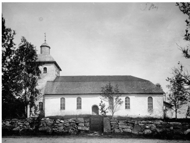
Fotografi taget från söder. Sedan fotot togs har muren lagts om och grinden bytts ut. Fotograf och tidpunkt okänt. Foto Riksantikvarieämbetet.

År 1944 restaurerades kyrkogårdsmuren som då hade varit förfallen i många år. Samtidigt avsattes pengar för att genomföra fyllningsarbeten på kyrkogården. Trädgårdsarkitekt Samuel Kaldén ritade vissa förändringar för att få plats med fler gravplatser. Bland annat fylldes diken i kyrkogårdens ytterkanter igen och grusgångar förlängdes och lades om. Området närmast kyrkan där inga gravar finns gjordes i ordning och fick parkkaraktär. Björkar och begstall planerades på kyrkogården. 1952 togs området mellan kyrkogården och kyrkan, där sockenvägen tidigare hade gått, i bruk för begravningar.