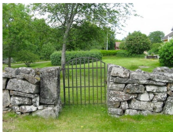
Ingång till kyrkogården från norr. Den leder från en numera privatägd tomt och används därför knappt.