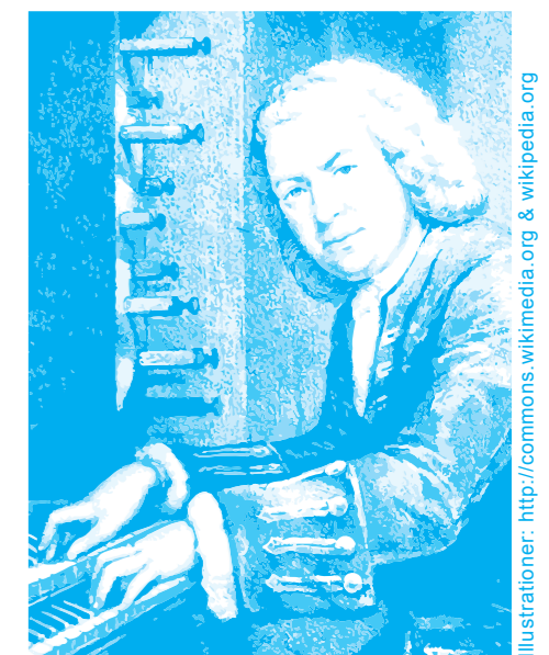
Illustrationer: http://commons.wikimedia.org & wikipedia.org