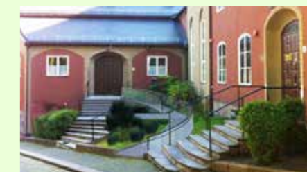
Fotomontage på ny entré

För att få hjälp att realisera detta har vi anlitat arkitektfirman Meinich som var dom som ritade om hallen och köket vid salarna 2010. Ritningarna är godkända av byantikvaren och nu ligger det en ansökan