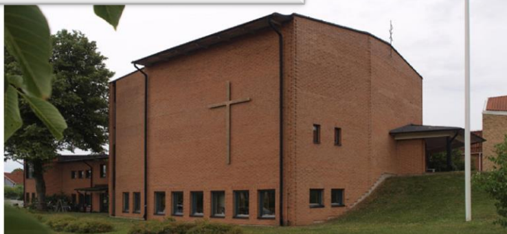
S:t Johannes kyrka