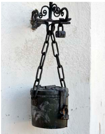
Rätt svar i förra numrets bildfråga: Fattigbössa, Bälinge kyrka

MEZZO heter vår nya barnkör, med ett tiotal underbara barn i årskurs 3. Vi övar varje onsdag 14.30, därefter är det andakt, pyssel och mat. Mezzo kommer att medverka på gudstjänster vid flera tillfällen till våren och kommer att sjunga en del tillsammans med flickkören Crescendo.