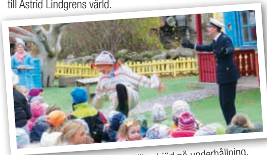
Pippi, Prussiluskan och Kling bjöd på underhållning.