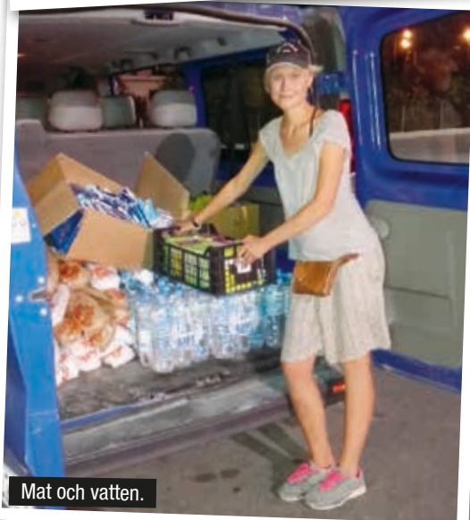
Mat och vatten.