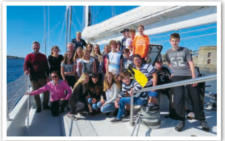
Konfirmander seglade med Elida i september.