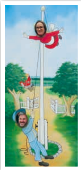
Utflykt med barngrupper och familjer till Astrid Lindgrens värld.