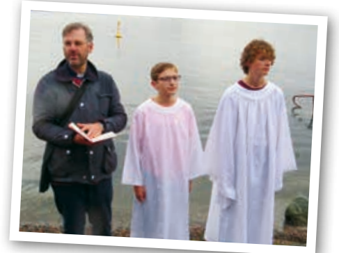
Dop på seglingen med Elida.