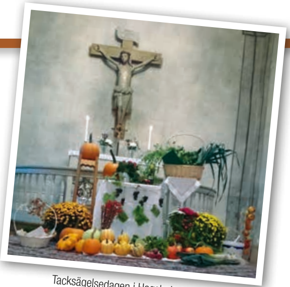
Tacksägelsedagen i Hagshults kyrka.