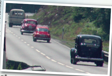
På väg till vägkyrkan