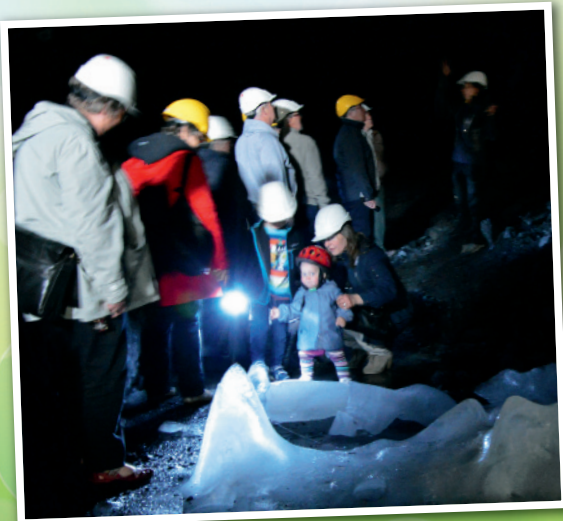
I Tabergs gruva