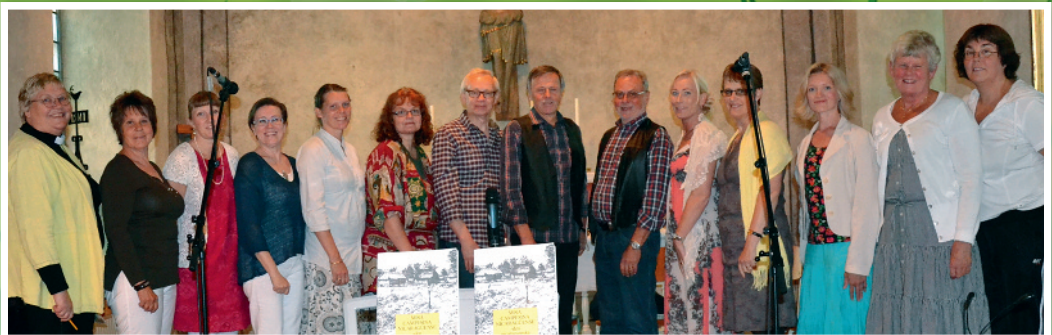
Hagshults kyrkokör med förstärkning, framförde Den Nicaraguanska bondemässan