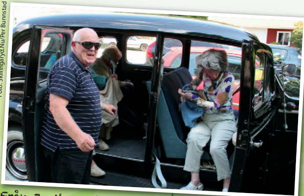
Från Jupiter och Sörgården kom man till Åkers vägkyrka med veteranbilar