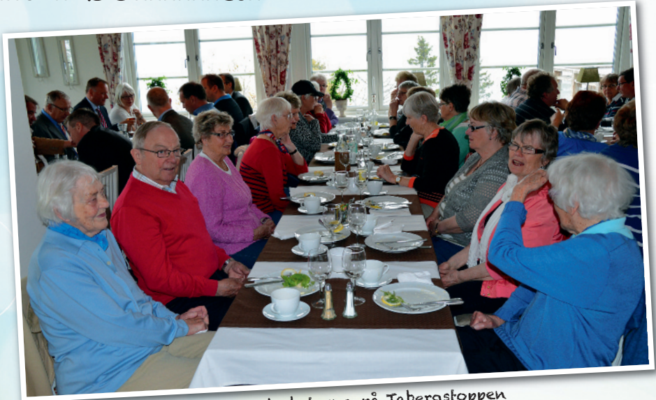
Diakoni- och kyrkobladsmedarbetarna på Tabergstoppen