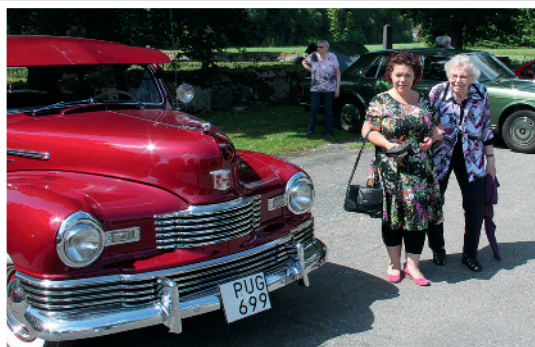
Härligt väder under vägkyrkan