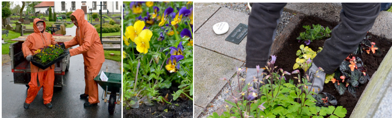
Året runt genomförs gravskötsel på pastoratets kyrkogårdar. Lite regn står inte ivägen. Rätt kläder för väder gäller!