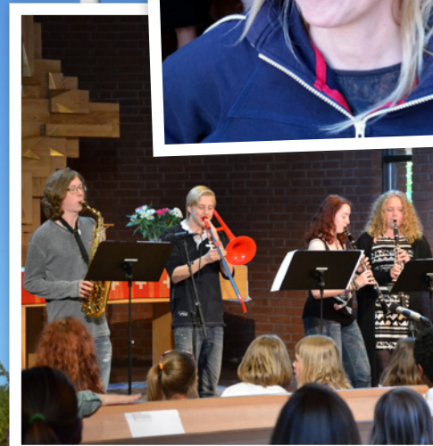
Under kvällen bjöds det på fantastiska musikinslag under programpunkten Öppen Scen.