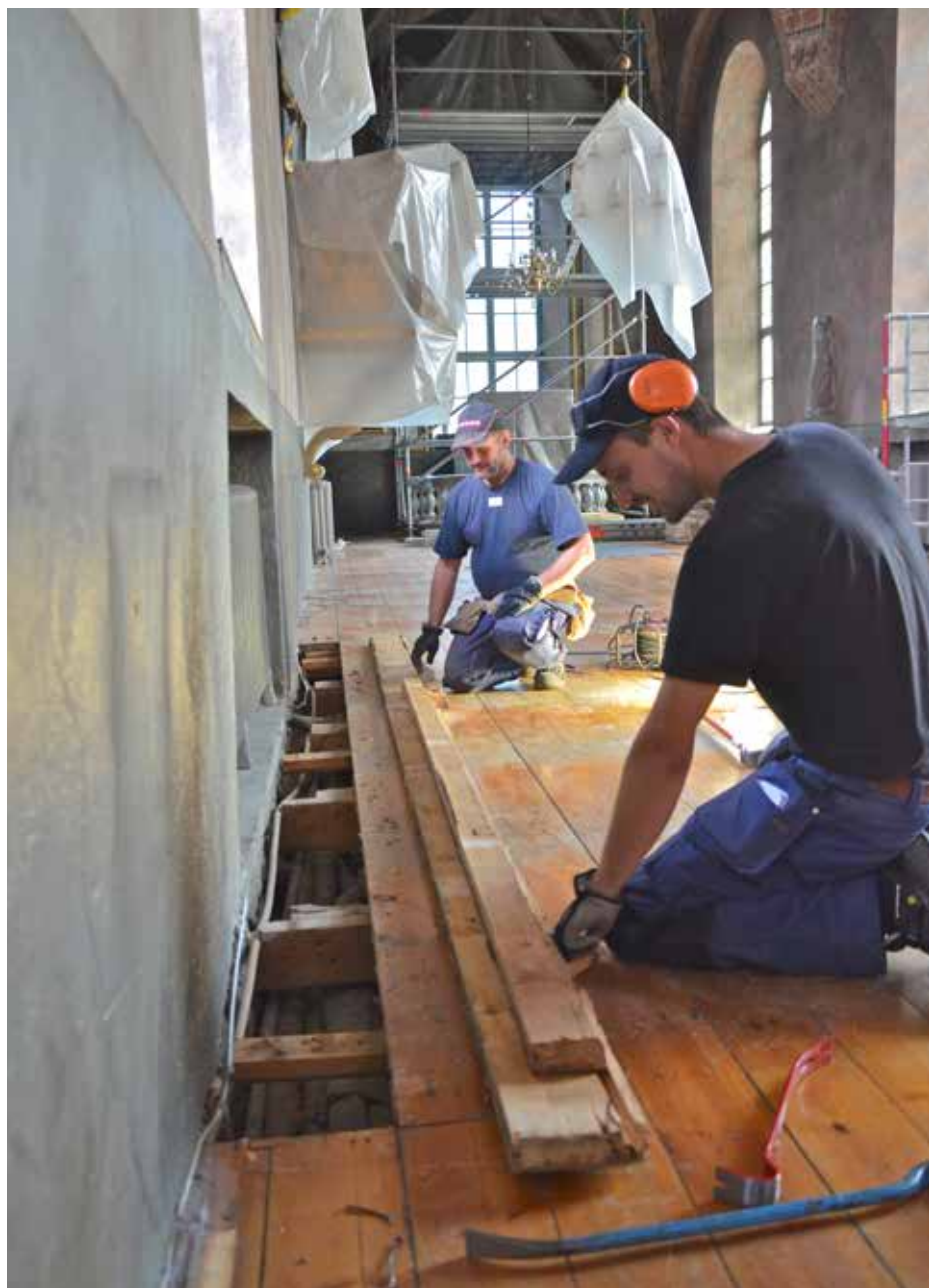
Golvbräderna tas upp längs väggarna för att kontrollera att allt är i sin ordning.