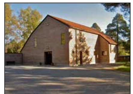
S:ta Maria kapell, Iggesund

"Svenska kyrkan i helgen" på fredagar i HT. Facebook: Enånger-Njutångers församling.