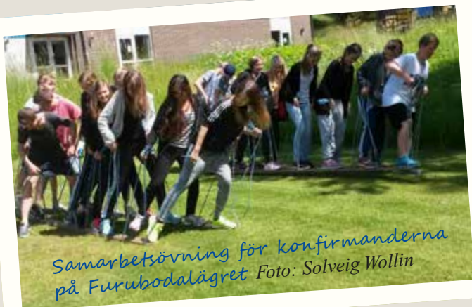
Samarbetsövning för konfirmanderna på Furubodaläget

Kungörelse ang. att Sveriges kungahus har fått en ny medlem, H.K.H. Prinsessan Leonore, Hertiginna av Gotland.