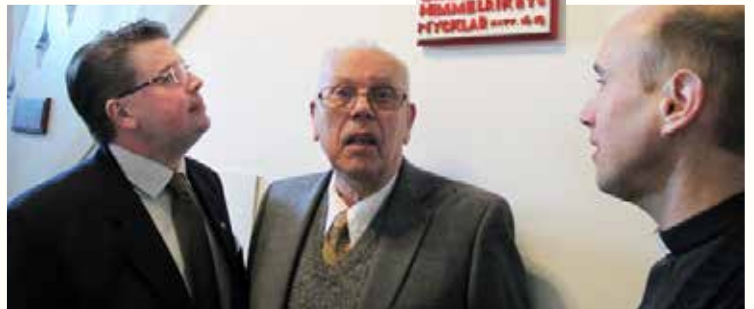
S:t Petrustavlan i Mjällby kyrka invigdes Skärtorsdagen 17 april