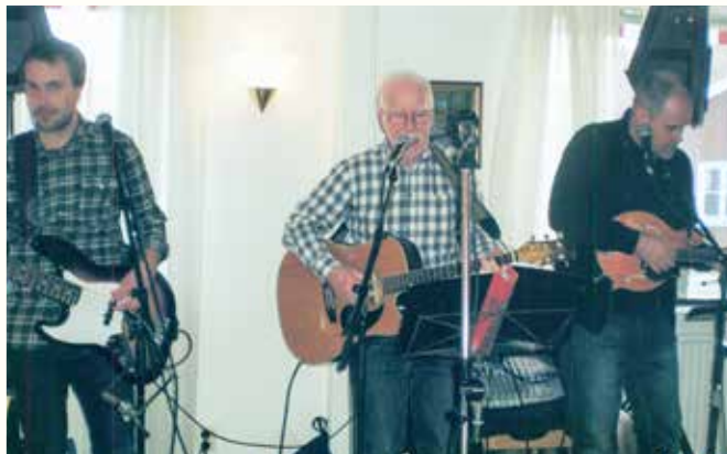
De Gubbs underhåller på Torsdagsträffen