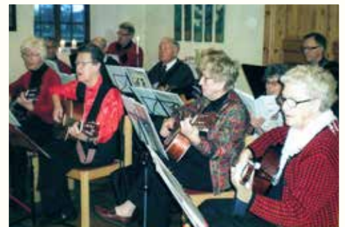
Hälleviks gitarrgrupp underhåller vid julhälsningen i Stenlängan.