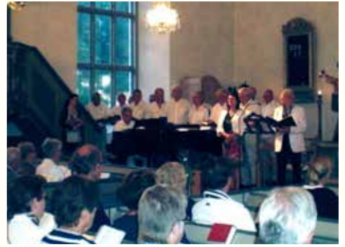
Musik och lyrik på midsom- mardagen.