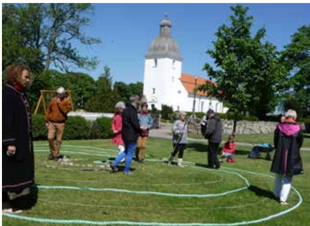
Labyrint- vandring vid Pilgrims- dagen 28 maj, ar- rangerad av Sensus