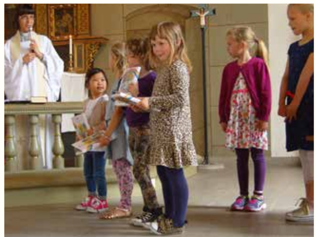
Bibelutdelning till 6-åringar, 11 maj.