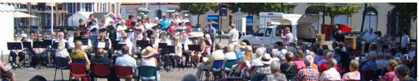
Killebomgudstjänst på Stortorget i Sölvesborg 6 juli.