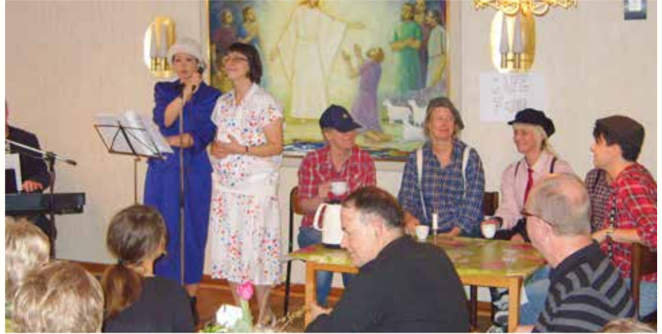
Café da Capo i Ysane församlingshem 1 mars.