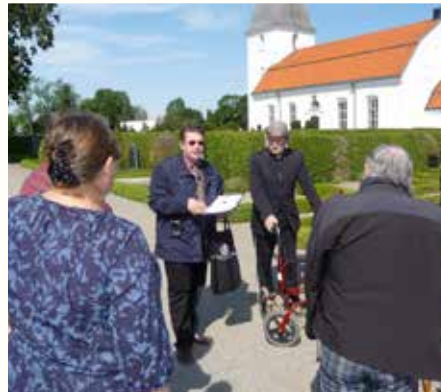
Mjällby kyrka är som vanligt vackert dekore- rad vid skördeguds- tjänsten.