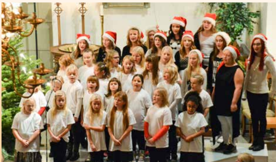
Julkonserten i Mjällby kyrka 2014.12.21