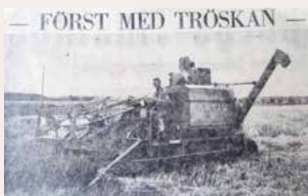
Fotot tillhör Gladis Nilsson

(Hämtat ur Sölvesborgs-Tidningen, sammanställt av Birgit Larsson)