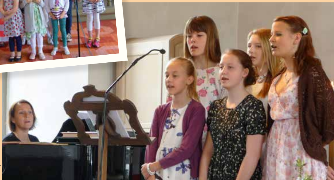
Barn från våra olika körer medverkar vid Moderaternas kyrksöndag 2015.04.26.