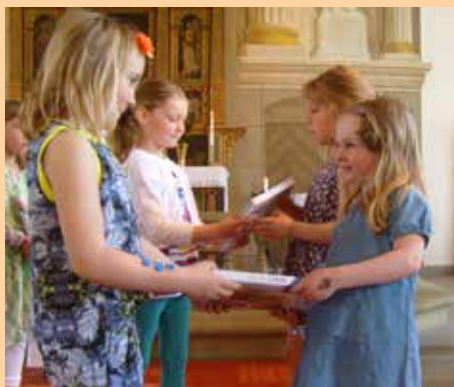
Barnen hjälper till att dela ut biblar till församlingens 6-åringar 2015.05.31.

Barnkören, som vi även kallar ”Musikalgruppen”, är för lite äldre barn och där jobbar vi mycket med dramaövningar och musikalerna men även med sångteknik och rytmik. Hösten 2015 kommer vi sätta upp en musikal ihop med de andra barnkörerna i kontrak-