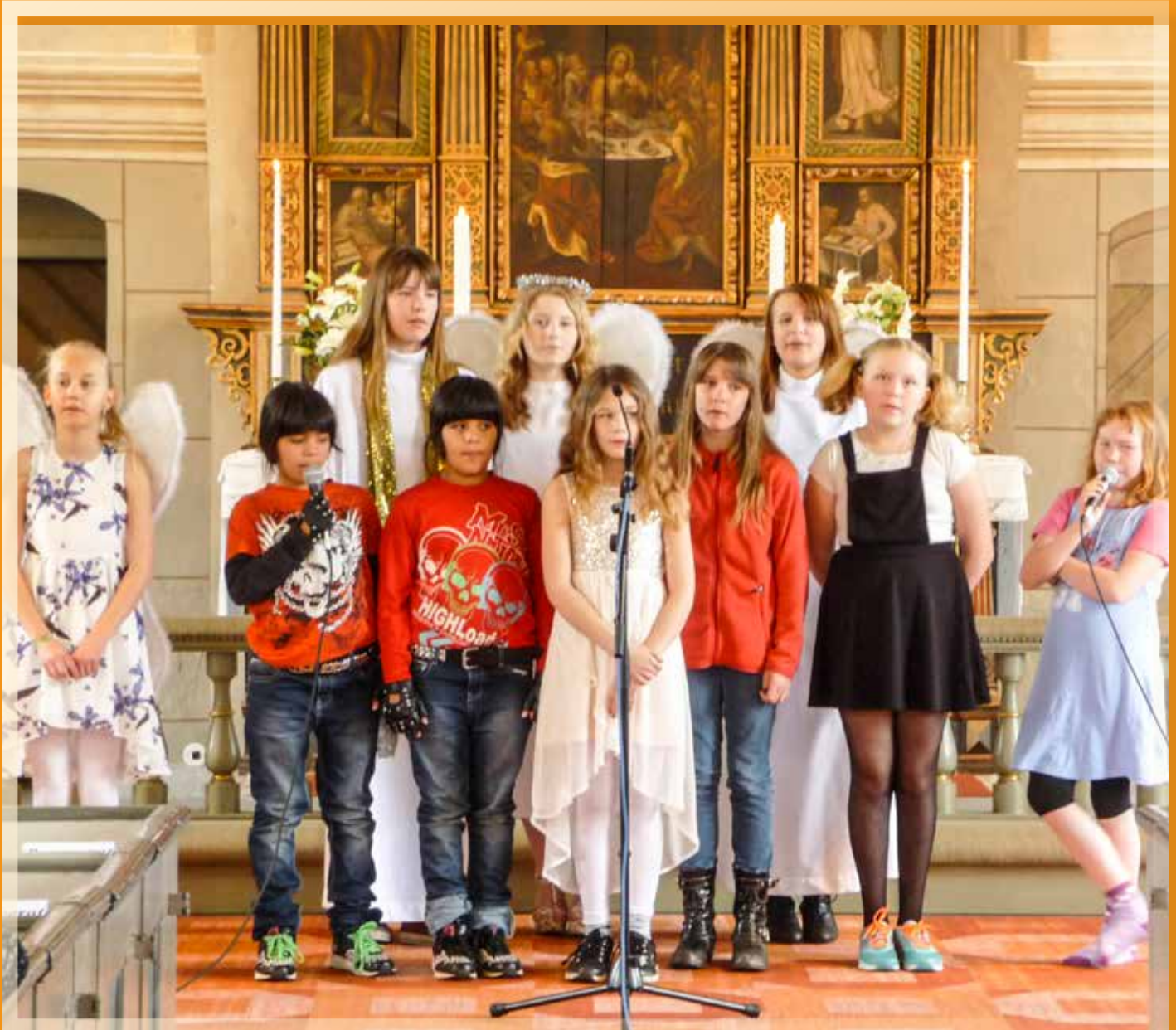
Musikalen "Himlabus" framfördes 2015-05-10 av barn från våra duktiga körer.