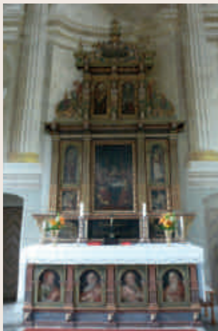
Altaruppsatsen i Mjällby Kyrka.

- Gurka per kg 2.85 kronor, blomkål per kg 1.05, rödbetor per kg 0.70 kronor, lök per kg 1.10 kronor, potatis 0.45 kr per kg, druvor per kg 2.00 kronor.