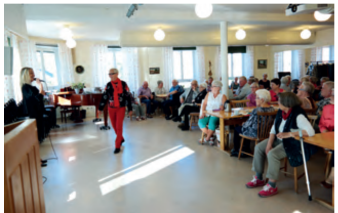
Snyggt och bekvämt - modevisning från Seniorshopen är ett återkommande inslag på Tisdagsklubben.

Fotnot: I förra numret av Kyrkbladet (som du även hittar på www.svenskakyrkan.se/kavlinge ) kunde du läsa om vår pensionärsklubb Tisdagsklubben. Varmt välkommen till Birgittasalen, tisdagar kl. 14!