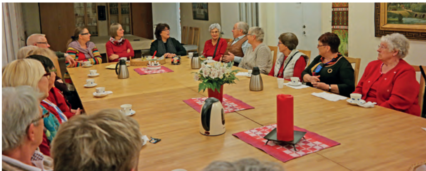
Efteråt stannar de som vill kvar för att fika och diskutera filmen.

Är du nyfiken på att vara med i någon av våra grupper hittar du all information om barn- och ungdomsverksamhet, sång- och musikverksamhet samt övriga aktiviteter på vår hemsida: www.svenskakyrkan.se/kavlinge . Där hittar du också förra numret av Kyrkbladet.