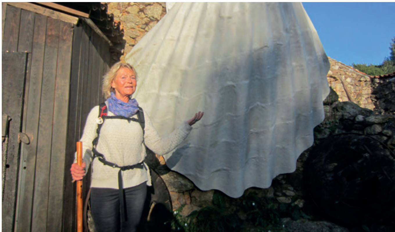
Man möter mycket spännande längs vägen. Symbolen framför alla för pilgrimsfärden till Santiago de Compostela är stora kammusslans skal. På grund av associationen till valfarten kallas stora kammusslan även pilgrimsnussla.