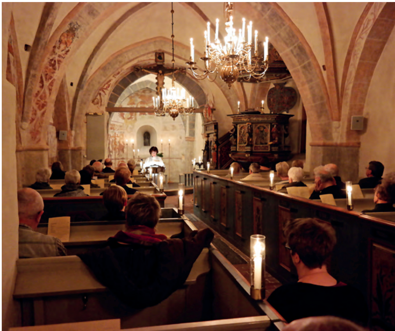
Tända ljus, tid för egen eftertanke och lugna meditativa sånger är kännetecken för Taizémässan.