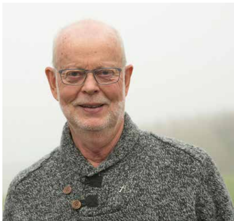
KG Hammar medverkar i tacksägelsehelgen i Gammelstad i höst.