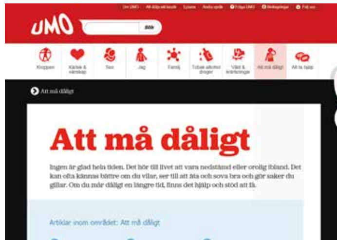
Frågorna på umo.se kan till exempel handla om stress och oro.

Fråga UMO ger unga människor möjlighet att ställa frågor anonymt och sedan får de svar av någon professionell, exempelvis en sjuksköterska eller psykolog. Anonymiteten garanteras genom ett tekniskt system. Inga personuppgifter lagras. De vuxna som svarar undertecknar där emot med namn och yrkestitel för att det ska vara tydligt att hjälpen är professionell. Årliga utvärderingar vi-