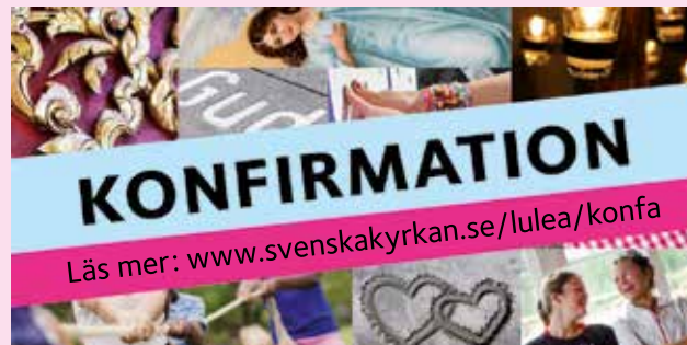
ILLUSTRATION: HANNA WALLENBERG

Det är inte bara när det är gudstjänst eller konsert man kan gå i kyrkan. Flera kyrkor håller öppet på vardagarna under sommaren. Luleå domkyrka har öppet måndag-fredag kl. 10-18 den 15 juni-14 augusti, resten av sommaren kl. 10-15. Sommarguider kan berätta om domkyrkan för turister och andra besökare. Örnäs kyrka har öppet måndag-fredag kl. 10-14 året runt. Nederluleå kyrka i Gammelstads kyrkstad har öppet måndag-fredag kl. 8-20 den 14 juni-16 augusti.