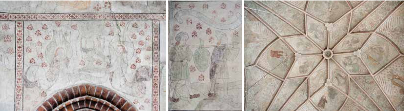
Bleknade kalkmålningar i Nederluleå kyrka.