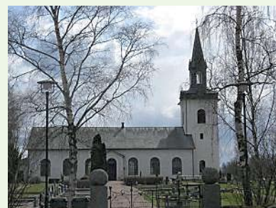
TEXT OCH FOTO: JENNY CARLSON

Man har också byggt till förråden för maskinparken samt byggt en offentlig toalett.