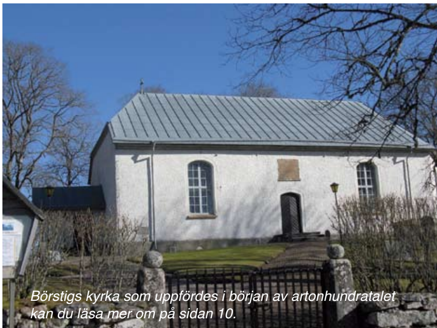
Börstigs kyrka som uppfördes i början av artonhundratalet kan du läsa mer om på sidan 10.