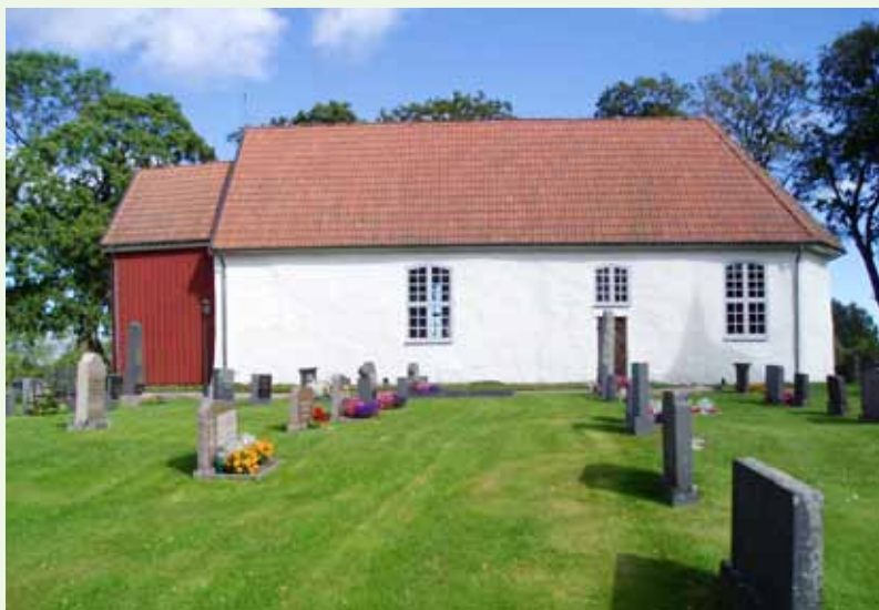
TEXT OCH FOTO: JENNY CARLSON

NÄR DU HAR åkt den långa slingrande vägen till Fivlereds kyrka, njutit av utsikten från kyrkbacken och kliver in i kyrkorummets så ta en extra titt på nummertavlan i gustaviansk stil för den är väldigt speciell!