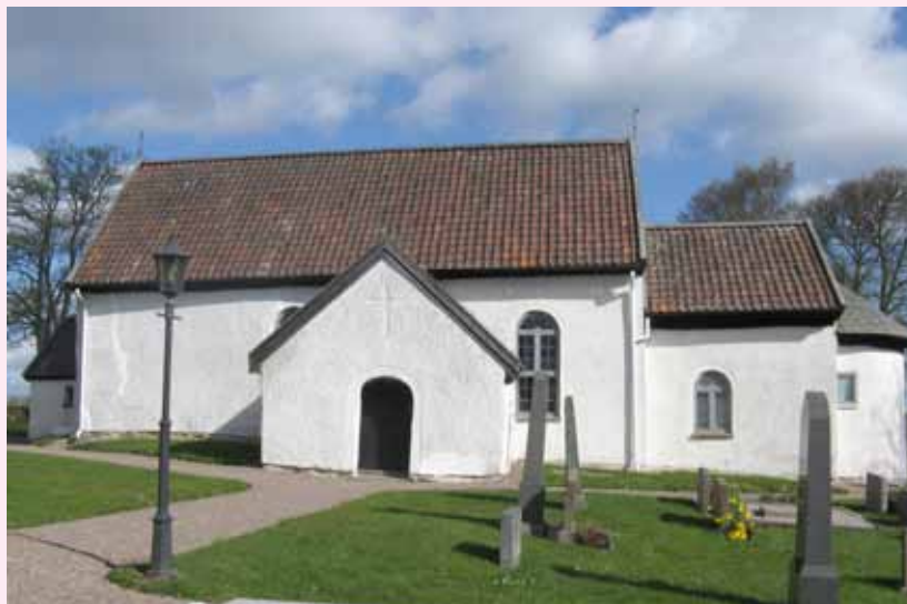
TEXT OCH FOTO: JENNY CARLSON

GÖTEVE KYRKA HAR på senare år genomgått en omfattande renovering där man bytt golvet under bänkarna, dragit ny el i kyrkan, dränerat utvändigt och gjort diverse nya blyinfattningar på fönstren, mycket för att förbättra fuktigheten i kyrkan.