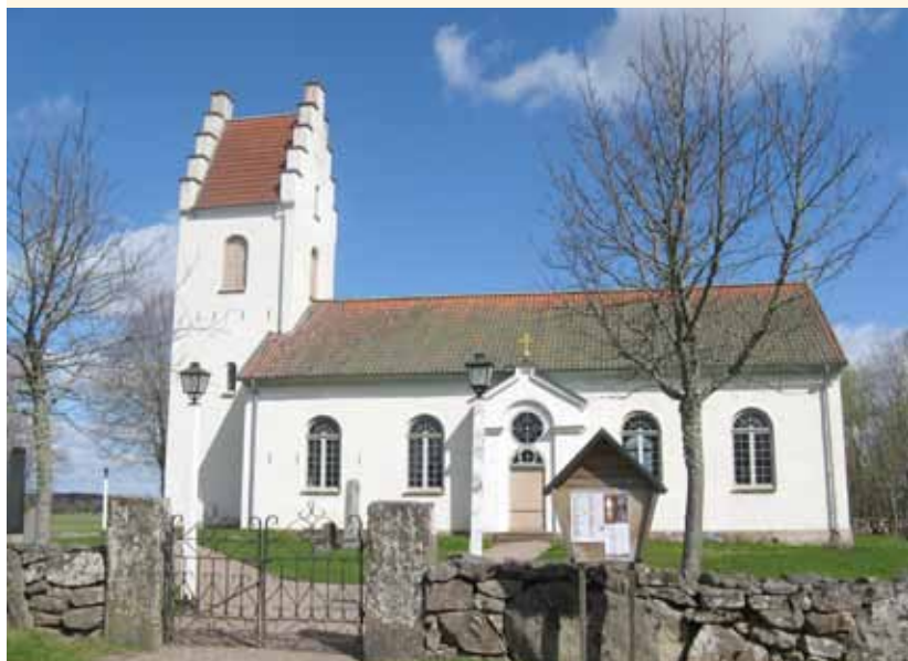
TEXT OCH FOTO: JENNY CARLSON

I BÖRJAN AV 1990-talet gjordes en invändig renovering då man gjorde om putsen, bytte el och dekormålade.