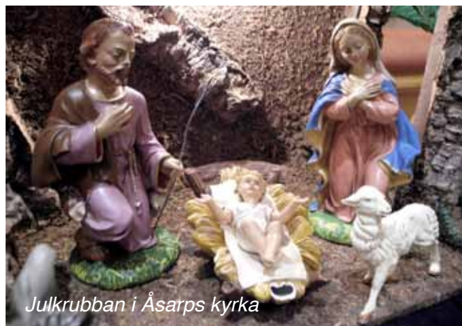
Julkrubban i Åsarps kyrka

VI VÄNDER PÅ PERSPEKTIVET. Kan det vara så att vi är de som vandrar i mörkret och behöver ljus. Tänker vi så blir det annorlunda. Vem är bärare av ljus till oss? Orden i Jesaja handlar också om att ljuset – hoppet – kommer på ett oväntat sätt.