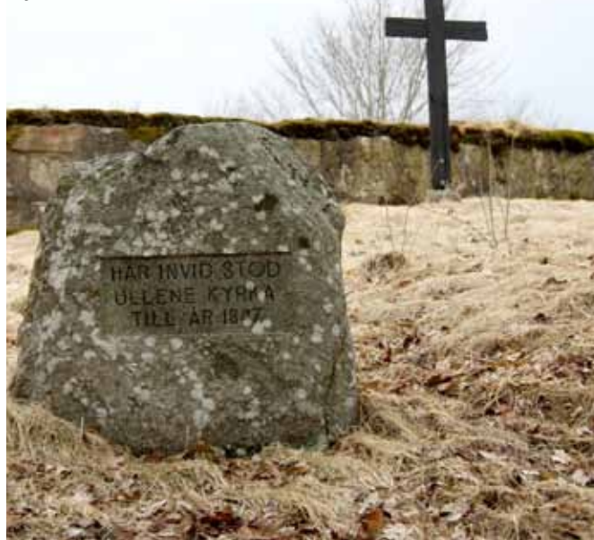
Kyrkoruinen i Ullene

ULLENE KYRKORUIN VÅRDAS nu av medlemmar i Ullene Hembygdsförening.