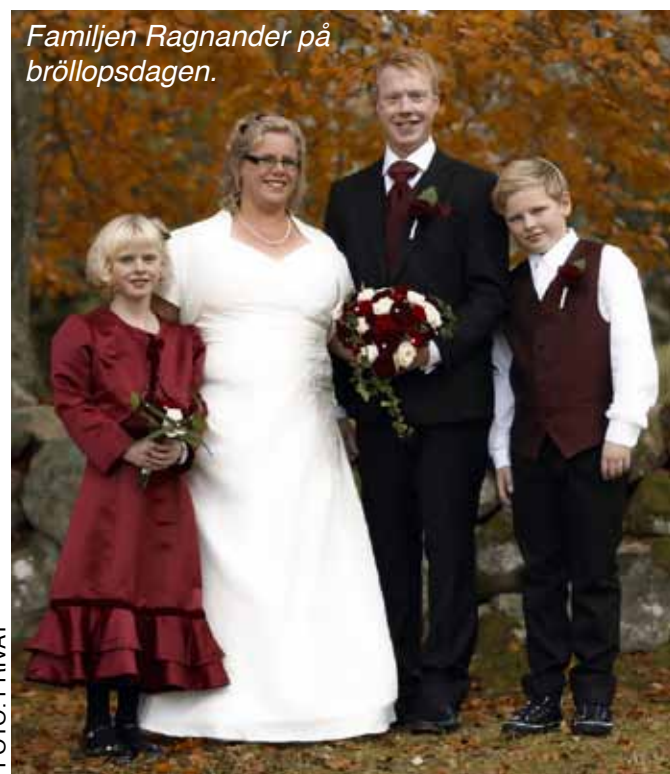
Familjen Ragnander på bröllopsdagen.

I SVERIGE ÄR DET TRADITION att brudparet går fram tillsammans, som en symbol för att kvinnan själv väljer sin man och mannen själv väljer sin kvinna och att de frivilligt och jämställda vandrar till vigseln.