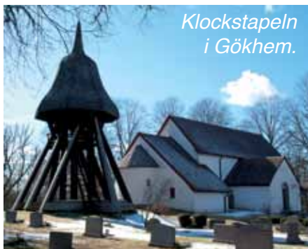
Klockstapeln i Gökhem.