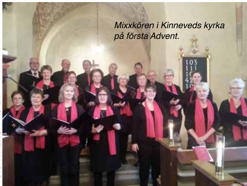
Mixxkören i Kinneveds kyrka på första Advent.

SKULLE DU VILJA vara med i Mixxkören, eller i någon annan av körerna i Floby pastorat? Tveka inte att kontakta musikerna! Du hittar deras kontaktuppgifter på sidan 15.