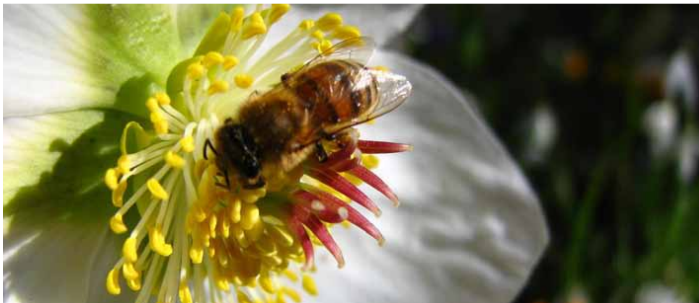
TEXT: NÅGRA BIDLARE GENOM VERNA LAGERSTRAND.