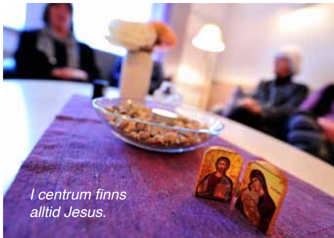
I centrum finns alltid Jesus.