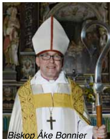
Biskop Åke Bonnier